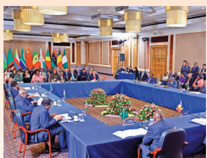
▲當地時間8月24日晚，國家主席習近平和南非總統拉馬福薩在約翰內斯堡共同主持中非領導人對話會。

以文明交流超越文明隔閡 習近平指出，中國正在以中國式現代化全面推進中華民族偉大復興，非洲正在全力建設和平、團結、繁榮、自強的新非洲。中非雙方要同心協力，為實現各自發展願景創造良好環境。要共同推動建立公正合理的國際秩序，旗幟鮮明反對殖民主義遺毒和各類霸權主義行徑，堅定支持彼此維護核心利益，理直氣壯堅持發展中國家的正義主張。要共同維護和平安全的全球環境，踐行共同、綜合、合作、可持續的新安全觀，倡導以對話彌合分歧、以合作化解爭端，推動政治解決國際和地區熱點問題，維護世界和平穩定，維護全球生態環境安全。要共同建設開放包容的世界經濟，推動構建開放型世界經濟，讓發展中國家更好融入國際分工，共享經濟全球化成果。以文明交流超越文明隔閡，促進文明包容互鑒。