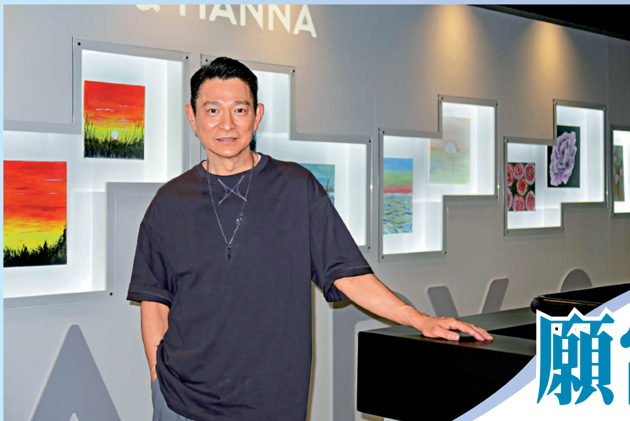
▲劉德華表示自己在藝術方面仍是學生。

劉德華加入演藝界40多年，參與及製作了很多經典影視及音樂作品，在文化領域的多元身份，亦得到大眾的認可。最近他首度跨界藝術圈，聯同五位藝術家，創設出「1/X劉德華的藝術空間」，讓觀眾更深入了解他的藝術世界。劉德華說：「我在藝術方面仍是學生，今次充當擺渡人的角色，希望透過我讓大家接觸不同的藝術。」