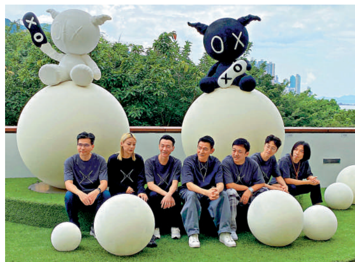
▶劉德華（中）等在戶外展區合影。

「1/X劉德華的藝術空間」展覽籌備接近九個月，昨天於西九文化區自由空間正式開幕，劉德華（華仔）親到現場接受傳媒訪問，並率先介紹首個展區《途Always》。而有份參與創作的五位藝術家許倬爾、STICKYLINE的梁子程與黎意雄、林子思、黃玉龍以及策展人莫偉康，亦有出席。