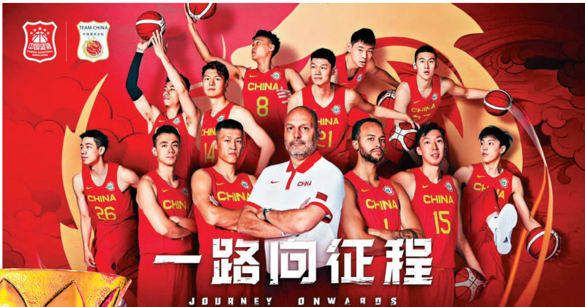
▲中國籃球隊製作海報為出戰世界盃造勢。