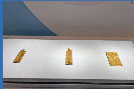
▲「南海I號」沉船出土的各種金葉子。