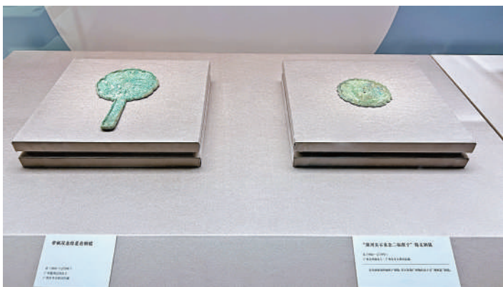
▲在廣州出土的「湖州造」銅鏡。