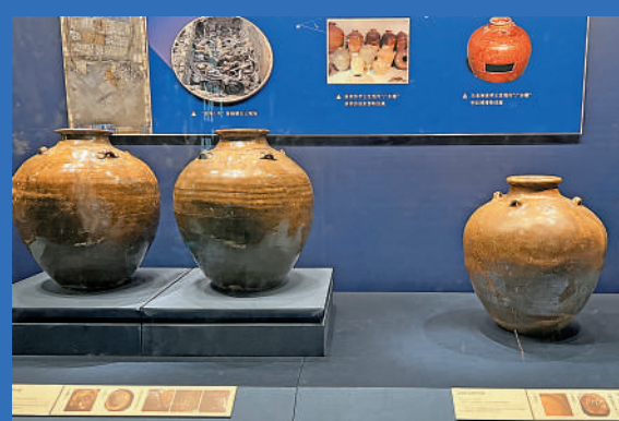
▲「南海I號」沉船出土的醬釉印花紋四耳罐。