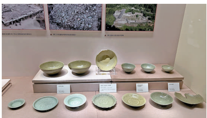
▲「南海I號」沉船出土的各種龍泉青釉瓷器。

海上絲綢之路」正在南越王博物院王墓展區展出。展覽分為「南海I號」的困惑、「南海I號」的旅程、廣州出發的密碼三大部分，共展出了12家文博單位的400餘件/套文物，其中超過三分之二文物為首次展出。展覽展出了大批香港九龍聖山遺址、香港大嶼山竹篙灣遺址、澳門聖保祿學院遺址出土，產自內地各窑口的瓷器，這些遺物是中國瓷器從粵港澳大灣區走向世界的實證材料。展覽將持續至10月8日。