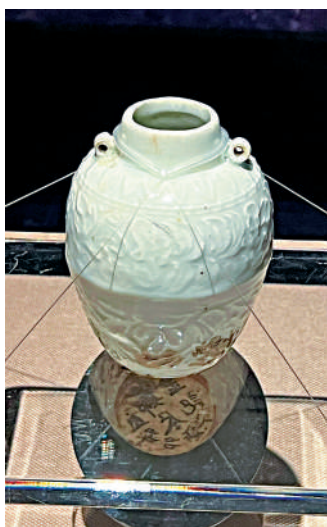
「南海I號」沉船出土的墨書「鄭盡金記直癸卯歲次」青白釉印花雙繫罐。

為了這次出海，我置辦了不少湖州的銅鏡。聽說現在流行區域產業化，講究品牌效應。其實在我生活的年代，很多商品已經形成區域化生產，例如青銅鏡主要產自兩浙，以湖州鏡最為有名。商家在產品上標記產地、工匠名、商號名等，逐漸形成品牌，湖州「石家銅