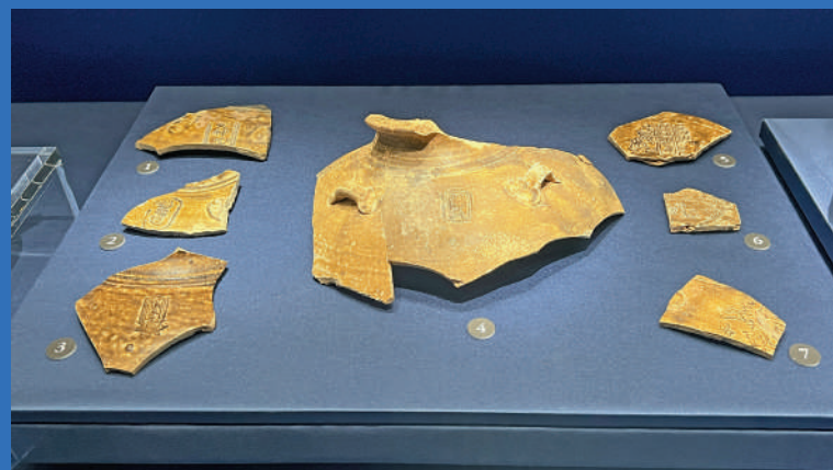
▲廣東各地出土的與「南海I號」高度一致的宋代印文、印花醬釉罐標本。