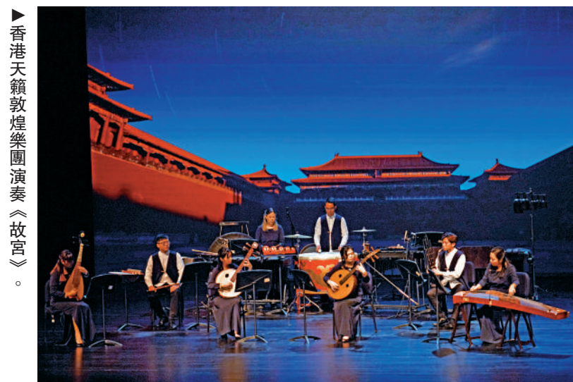
▶香港天籟敦煌樂團演奏《故宮》。

樂團相信透過是次音樂會，除了為大灣區觀眾呈現傳統與創新充分融合的精彩演出外，還可以以中華傳統優秀文化作為紐帶、加深文化藝術上的兩地交流，進一步促進粵港澳大灣區城市之間民心相通，為鞏固香港作為中外文化藝術交流中心的地位和目標作出貢獻。