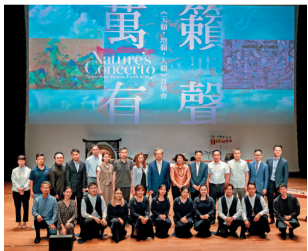
▲樂團成員與嘉賓合照（深圳站）。

【大公報訊】香港天籟敦煌樂團以「萬籟有聲：《天籟，地籟，人籟》」為主題於8月11日至17日在大灣區內深圳、廣州、珠海、佛山四個城市舉行音樂巡迴，獲得好評如潮，成功將香港青年人演繹的中國傳統文化和音樂帶入內地。是次巡迴是新冠疫情後，首批香港青年樂團赴大灣區重點城市巡迴。