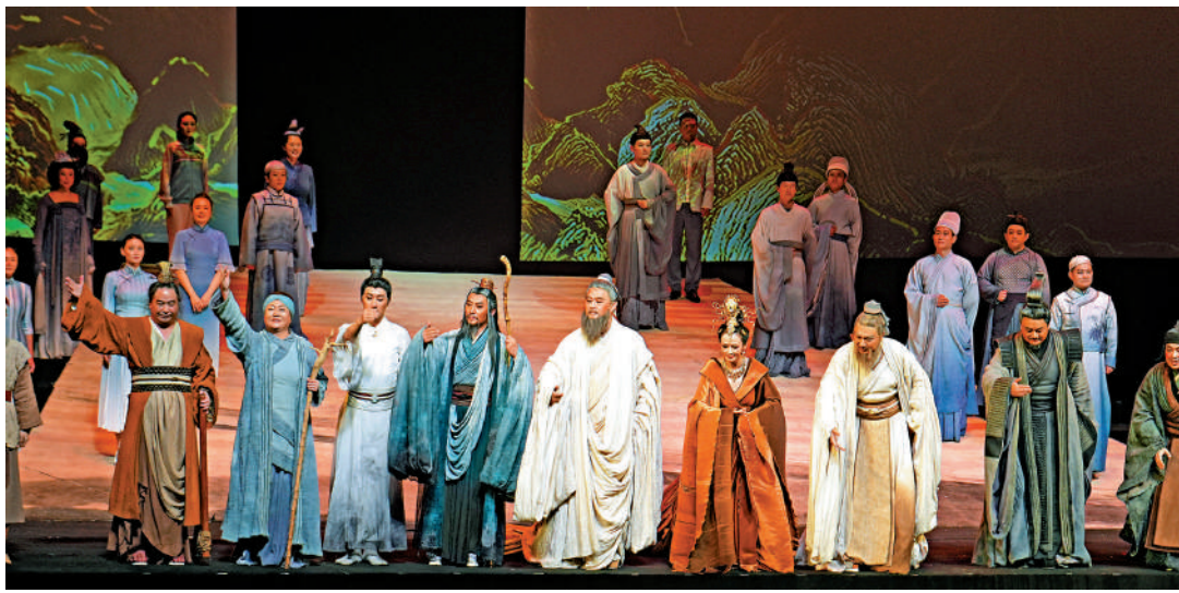
《孔子》以春秋末期諸侯爭霸為歷史背景。

本劇分為九個篇章，將孔子一生當中重要的事件，通過不同篇章的形式在舞台上呈現，着力表現孔子追求「大道之行，天下為公」的理想和