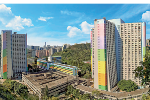
▲順安邨換上鮮艷色彩，讓居民提升幸福感。

內地近年新興的市內公園「室外智能健身系統」成了熱門打卡地，在深圳，包括深圳灣公園、中心公園、蓮花山公園等五個公園，已引入免費智能健身房，室外場地更開闊，且空氣清新，除了各式健身器材，健身區同時設置適合小朋友鍛煉的跳飛機、短跑道等設施，保證一家大小都有鍛煉區域。