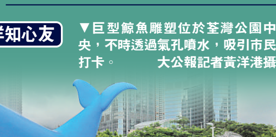
▼巨型鯨魚雕塑位於荃灣公園中央，不時透過氣孔噴水，吸引市民打卡。