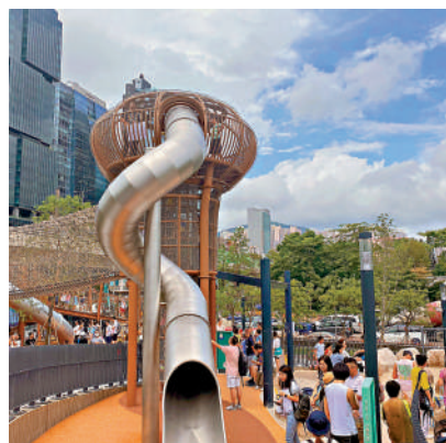
▲茶果嶺海濱公園設有樹屋和滑梯等玩樂設施。