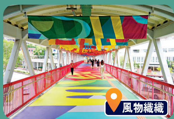
▲荃灣擁有濃厚的紡織歷史，大河道行人天橋添上彩色布匹裝飾。