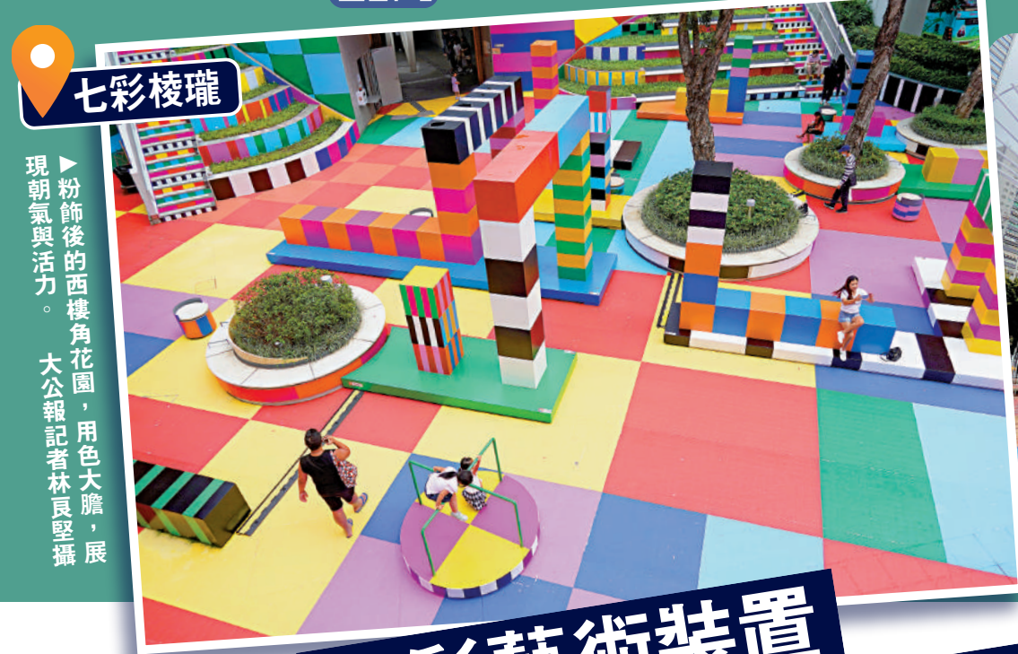
►粉飾後的西樓角花園，用色大膽，展現朝氣與活力。