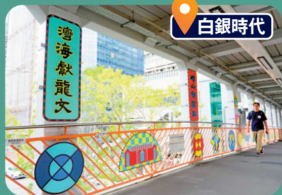
▲街頭藝術元素融入大涌道行人天橋，講述荃灣的風物故事。