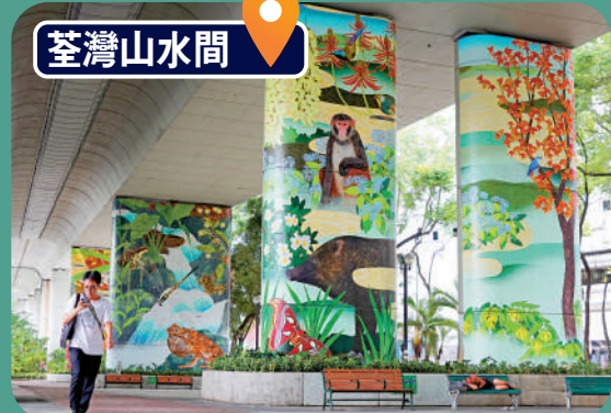
▲海盛花園天橋底成為藝術家的巨型畫廊，展示大幅山生態。

女兒很喜歡鯨魚憨厚的造型，美中不足的是噴水表演太短了，會和家人散散步找找其他藝術裝置。