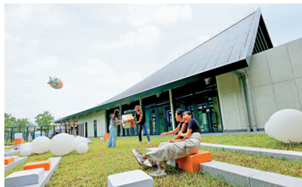
◀「舍區」內設有方糖形狀的藝術傢俬，市民可隨意組合使用。

「舍區夏日嘉年華」是「開心香港」響應活動之一，以創意健康為主題，設有一連串免費的多元文化藝術活動節目。嘉年華期間，鯽魚涌區內包括太古坊超過40間指定人氣餐廳及