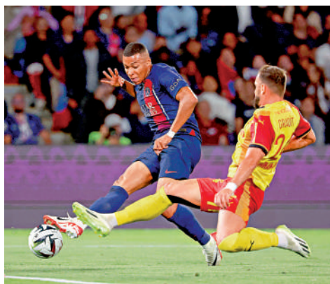
麥巴比(左)獲准上陣，對朗斯射入兩球。

麥巴比與聖門似乎已撥開雲霧，麥巴比可按照意願多留隊一季，而聖門在連失美斯和尼馬後，亦需留下麥巴比在鋒線領軍，而近兩仗亦完全證明麥巴比對球隊的重要性，況且聖門主席艾基拉法也希望「買時間」，趁這一年繼續游說，期望麥巴比改變初衷，相信皇馬最快明年1月才直接洽麥巴比。