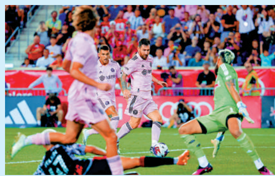
美斯(右二)首次在美職聯上陣，並取得一個入球。

【大公報訊】據ESPN FC報道：阿根廷球星美斯終於後備登場作出美職聯「地標戰」，並重新取得「土哥」，協助國際邁亞密作客以2：0擊敗紐約紅牛，亦是邁亞密近12場美職的首次勝利，又一次證明美斯一人之力，徹底改變邁亞密的命運。