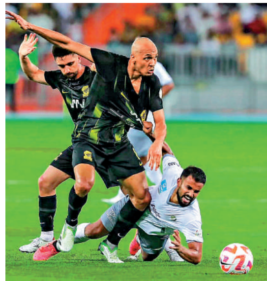
沙拿前隊友法賓奴(前)已轉投伊蒂哈德。