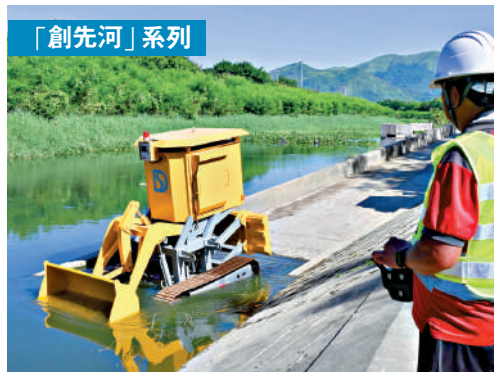
▲渠務署最新款的機械人配備鏟斗和推土裝置，專為河道清淤工作而研發。