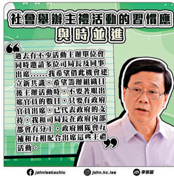
李家超在Facebook發文，希望活動主辦單位不要着眼於出席官員的數目。

政府消息人士指出，有關建議不代表包含所有活動，例如大型活動如「七一」回歸、動員活動等，仍需要盡量多官員參加。至於已經安排及約好官員出席的活動，官員會繼續出席。