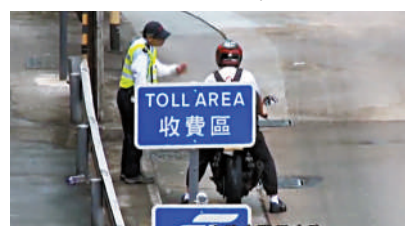
▲有電單車司機停在路旁向職員詢問。

「易通行」日期有待公布，政府隧道費代用券仍可在這兩條隧道使用。持有隧道費代用券的人士，亦可於明年6月30日前到全港八個指定停車場的退款中心辦理退款。