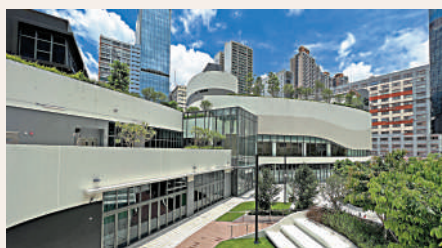
▲「東蒲」已於六月起分階段投入運作，冀成為九龍東青年新地標。

室月租5000元至10000元，流動辦公桌月租1200元，現時租用流動辦公桌更有800元月租「早鳥優惠」。 國際交流營舍則提供30間客房、逾100個宿位，預期最快年底投入服務。營舍除計劃用作青年交流活動，亦考慮開放公眾預約，每個床位每日租金約200元起。 另外，今日是東華三院一年一度的賣旗日，善款將用作支持該院的社會福利及教育服務發展，若大家見到賣旗義工，記得支持一下。