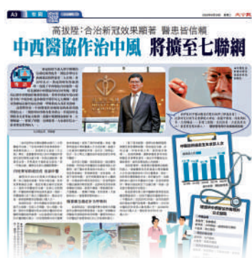
《大公報》昨日率先報道醫管局計劃將中西醫協作治療中風服務，擴至七個聯網。

肯定中醫診所的中醫師在新冠疫情期間參與抗疫工作的貢獻。他欣悉中醫診所為配合增加資助門診名額的政策已準備就緒。 醫管局負責推行「中西醫協作先導計劃」，透過中醫診所向選定病種(即中風、肌肉及骨骼痛症和癌症舒緩)的住院病人，提供中西醫協作治療。現時共有八間醫院參與計劃，並由中醫和西醫共同就各個病種制訂臨床治療方案。中西醫團隊共同評估病人是否適合中醫治療，並為合適的病人提供中西醫協作治療服務。病人可自行選擇是否參與。 醫管局在2023至24年度，逐步將中風治療中西醫協作服務擴展至醫管局全部七個醫院聯網的公立醫院，並將進一步研究展開新的癌症治療中西醫協作服務，支援不同階段的癌症病人。