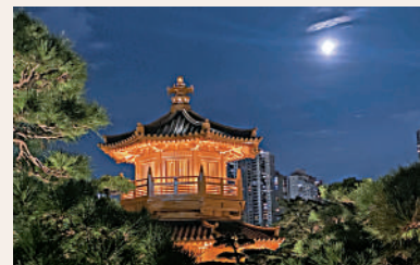
▲今月初本港亦有「超級月亮」出現。

「超級月亮」將於明晚再次出現！此次不僅是今年最大的滿月，更是本月內的第二次滿月，又被稱為「藍月亮」。香港太空館在社交平台上表示，月亮將會在本月31日晚上7時07分從東邊升起。鄭晴已根據各位網民意見，整理出四個預計絕佳的觀星位置，包括太空館天文公園、石澳鶴咀、長洲西園農莊，以及大嶼山大東山，大家千萬不要錯過！ 被稱為「藍月亮」，是否就能看到藍色的月亮呢？太空館為大家解惑，其實「藍月亮」是代表在同一個陽曆月份內出現兩次滿月時，對第二次滿月的稱呼，並不是指月亮會變成藍色。 雖然「藍月亮」並不藍，但當晚的超級月亮依然值得觀賞。太空館介紹，每當月球處於或者差不多處於軌道上距離地球最近的位置，而又正好遇到滿月的時候，所謂超級月亮就會出現。月球本身雖然不會變大，但基於「近大遠小」的原理，令超級月