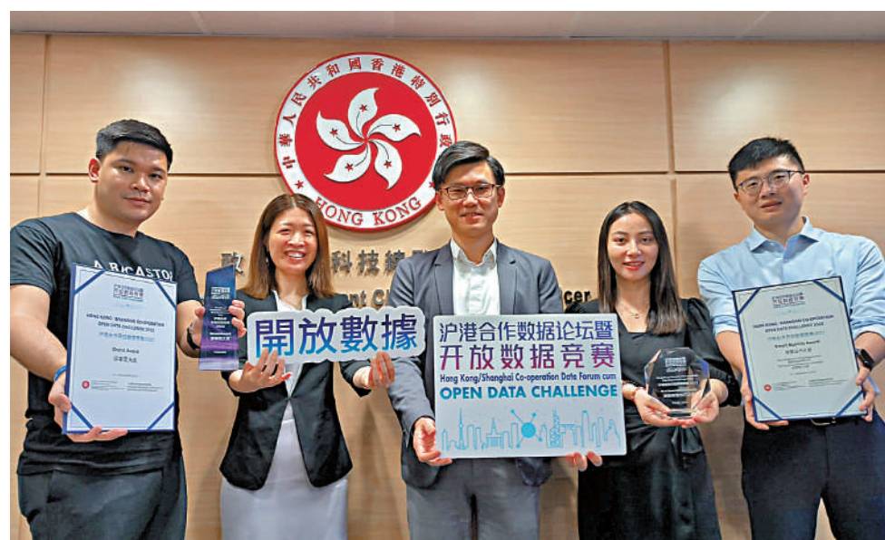
在滬港合作開放數據競賽中獲得兩項殊榮及評審團大獎。

油煙味大、城市裏難準確定位，以上困擾都市人的貼身問題，原來透過科技，活用政府開放數據，都能覓得解決方案。 剛結束的「滬港合作數據論壇暨開放數據競賽2023」，兩支香港隊伍獲獎，其中艾柏輪科技通過餐廳分布等開放數據，製作反映區域空氣健康風險的熱圖(Heat map)，為當局處理油煙污染提供參考。微度科技則以手機氣壓計，加上道路網絡數據等，準確區分使用者身處天橋、路面或隧道，甚至電梯內位置，為將來室內導航服務鋪路。