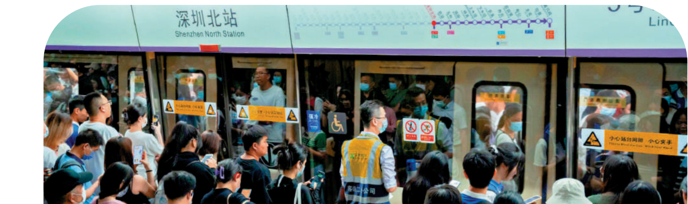
▲深圳市公共交通客流熱，圖為市民在地鐵深圳北站站外等候上車。

深圳市交通運輸局二級巡視員徐忠平表示，「深港一卡通、一碼通、一票通」的重大民生創舉為深港居民提供深圳地鐵、跨境巴士、香港地鐵無縫對接的一體化出行服務，給粵港澳大灣區的公共交通出行帶來了極大的便利。下一步，深圳市交通運輸局將扎實推動粵港澳大灣區交通互聯互通，努力構築更加便捷暢達的交通圈。