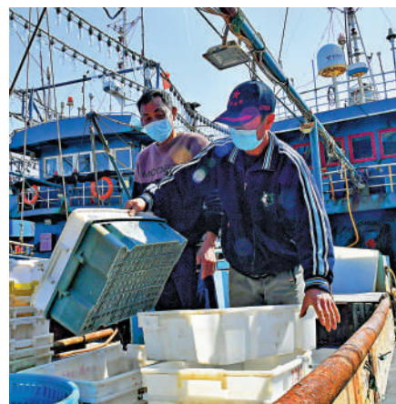
▲福建泉州的海員在船上作業。