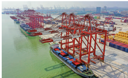
▲廣州港南沙港區四期全自動化碼頭。

● 放射性污染可能使部分港口和海岸線地區不適合船舶停靠、貨物卸載或人員進出，影響海洋運輸業的正常運作。