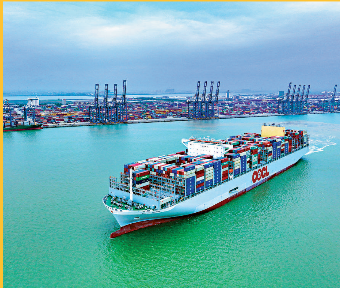
▲中國是目前全球最大的造船國和港口國，圖為遠洋貨輪出入廣東港口。