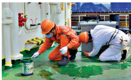
▲中遠海運船員正在對船舶進行保養。

● 放射性物質的污染可能會導致船舶表面積累放射性物質，增加船舶的維護和清潔難度，也可能導致船舶在某些地區的使用受限。