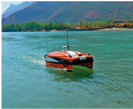
▲國產ME70無人船在監測作業。 受訪者供圖