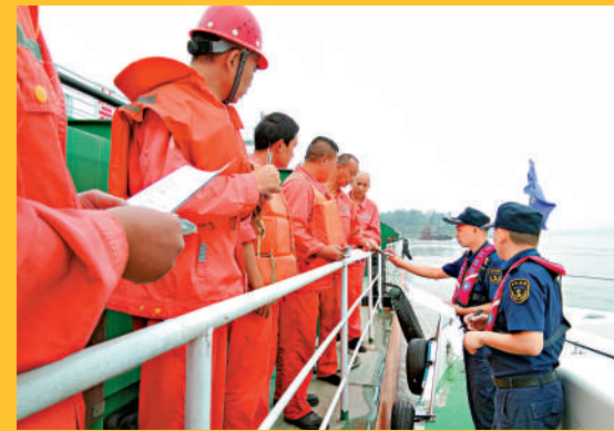
▲內地相關部門開展船舶防污染專項培訓。