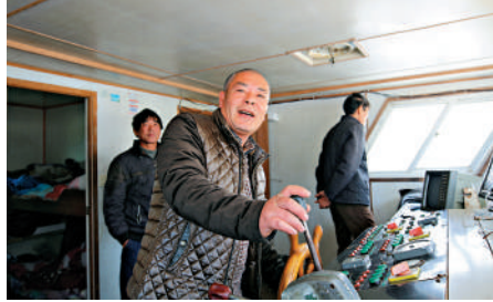
▲圖為一位船長在操控船隻。

● 海水若被核污染，將衝擊遠洋船舶「將海水淡化」，船員的正常生活將大受影響；而過大的淡水艙艙容將佔據貨、人空間從而影響船舶航運成本。