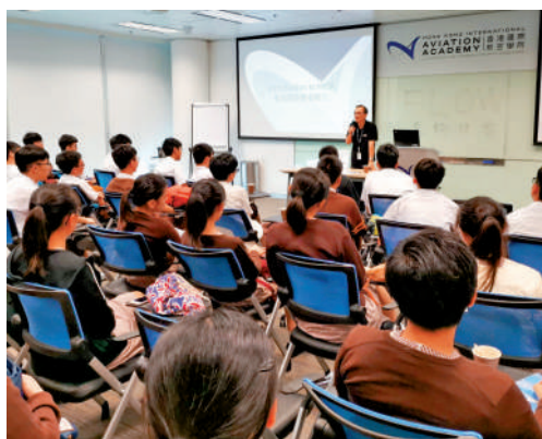
▲香港致力成為區內航空專業人員的搖籃。

▼專家建議香港在提升國際航空樞紐地位之餘，同時打造區域民航培訓中心。