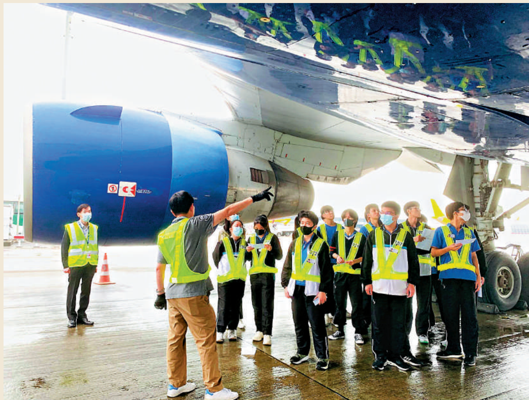
▲香港國際航空學院為香港航空業培育大量人才。