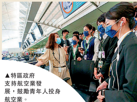
▲特區政府支持航空業發展，鼓勵青年人投身航空業。

元，現時推行多個計劃，其中與航空業相關的計劃包括「專業培訓課程及考試費用發還計劃」、「海運和航空業實習計劃」、「飛機維修專門課程部分學費退還計劃」、「香港航空獎學金計劃」，以及「航空營運培訓獎勵計劃」等，部分計劃的合資格申請人在完成核准課程或通過核准考試後，可獲發還一定比例的費用；或獲得一定金額的薪酬資助等。