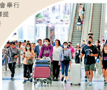
▲機管局預計，港機場客運量會於今年年底恢復至疫情前約八成，並於明年全面恢復。

招聘計劃 在「香港國際機場職業博覽會2023」上提供合共約100個就業機會，涵蓋20多個不同範疇的職位 機隊擴充 今年3月訂購15架波音737-9客機，並承諾採購不少於5架波音787Dreamliner