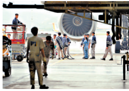
▲國泰曾舉行飛機安全傳媒工作坊，展示飛機常規維修流程。