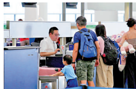
▲航企紛紛表示，未來將繼續積極招募人才加入，不斷擴大團隊。