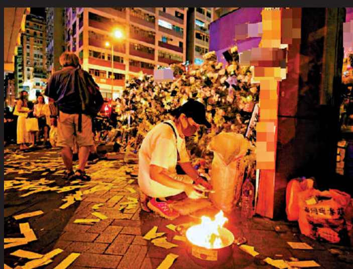
▲有反中亂港分子借四年前的所謂「831」事件在網上再次傳播相關假消息，意圖在海外煽亂並「倒灌」香港。