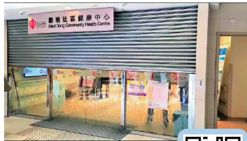
▲兇案發生後，社區健康中心落閘，暫停開放。