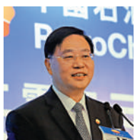
黃永章 中石油總裁