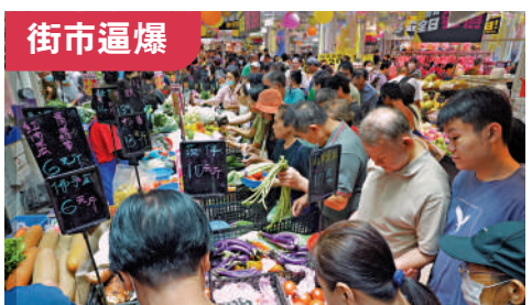
打風前夕，市民湧到街市搶購糧食。