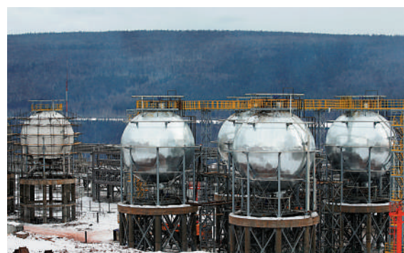
▲俄伊爾庫茨克石油公司的LNG儲氣罐。

今年1-7月，歐盟液化天然氣進口總量為1.335億立方米，其中俄液化天然氣佔比16%。俄羅斯成為歐盟第二大液化天然氣供應國，僅次於