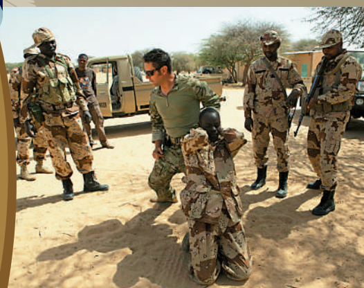
▲2014年3月，美國特種部隊士兵在尼日爾培訓當地軍隊。

分析指，美國近年重啟對非洲的關注，去年12月更時隔8年再辦美非峰會，旨在拉攏非洲國家，逼迫其在大國競爭中選邊站隊；如今又趁着法國勢力被迫從非洲退出之際，增強對非洲的控制力，以便更大地攫取當地的豐富資源，同時進行新的戰略布局。