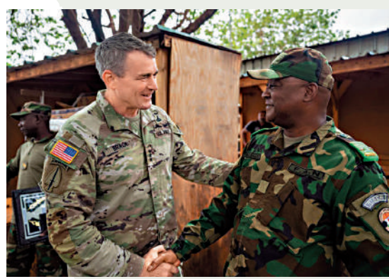
▼尼日爾高級將領帕爾莫（右）6月與美陸軍特種作戰司令布拉加會面。網絡圖片

根據美國國防部的數據，美國自2017年以來每年在非洲21個國家以「反恐」為名，執行約3500次軍事任務。然而，美國安全報告顯示，這些打着「反恐戰爭」幌子的行動往往適得其反，製造更多混亂。