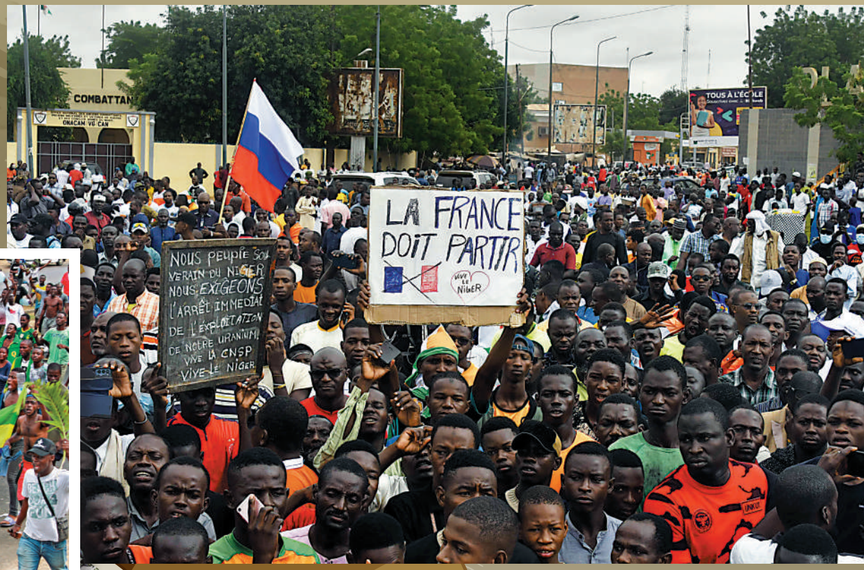
▲尼日爾發生政變後，民眾高舉反法標語示威。