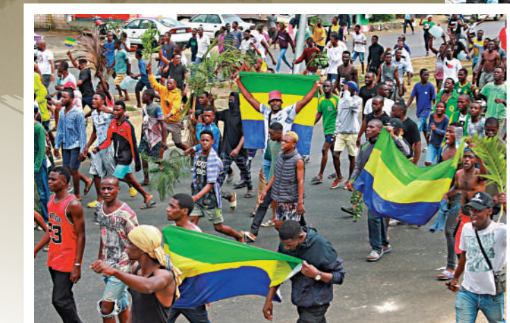
▲加蓬民眾8月30日上街慶祝軍方發動政變。

報道稱，美國在尼日爾駐軍約1300人，法國有約1500名士兵。美國在尼日爾北部城市阿加德茲耗資1.1億美元建造了全