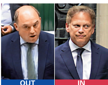
▲英國國防大臣華萊士(左)辭職，能源大臣沙普斯(右)接任。

華萊士在辭職信中呼籲政府不要隨意削減國防開支，表示將繼續支持英國政府。沙普斯則表示，「很榮幸」被蘇納克任命擔任國防大臣一職，並對華萊士為英國國防和全球安全做出的「巨大貢獻」表示敬意。他還在社交平台X上稱，英國將繼續「支持烏克蘭對抗俄