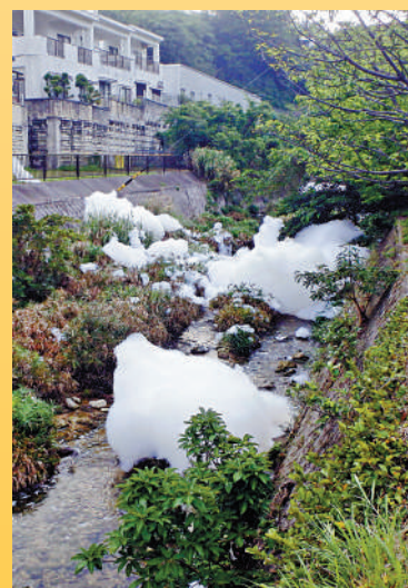
▲2020年，沖繩駐日美軍基地有毒泡沫滅火劑外洩。

物質不會自然分解，因此被稱為「永久化學物」。PFAS被廣泛用於化妝品、泡沫滅火劑等物品中。長期大量接觸會增加致癌風險。今年5月，東京都一個市民團體說，多摩地區進行抽血檢查的551人中，六成以上血液中PFAS含量超標，達到損害健康的程度。