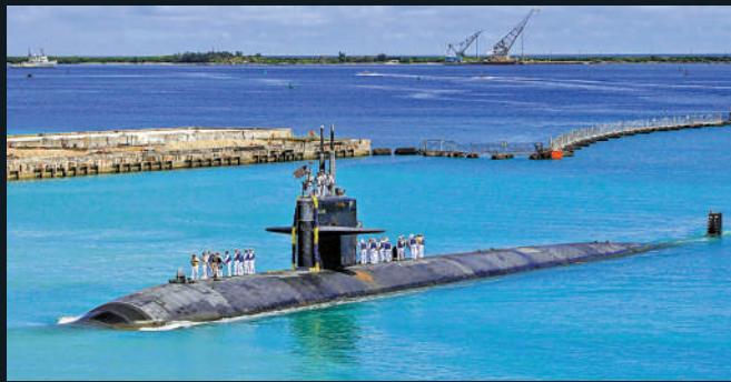
◀美軍在關島使用有毒除草劑。圖為美軍潛艇返回關島基地。