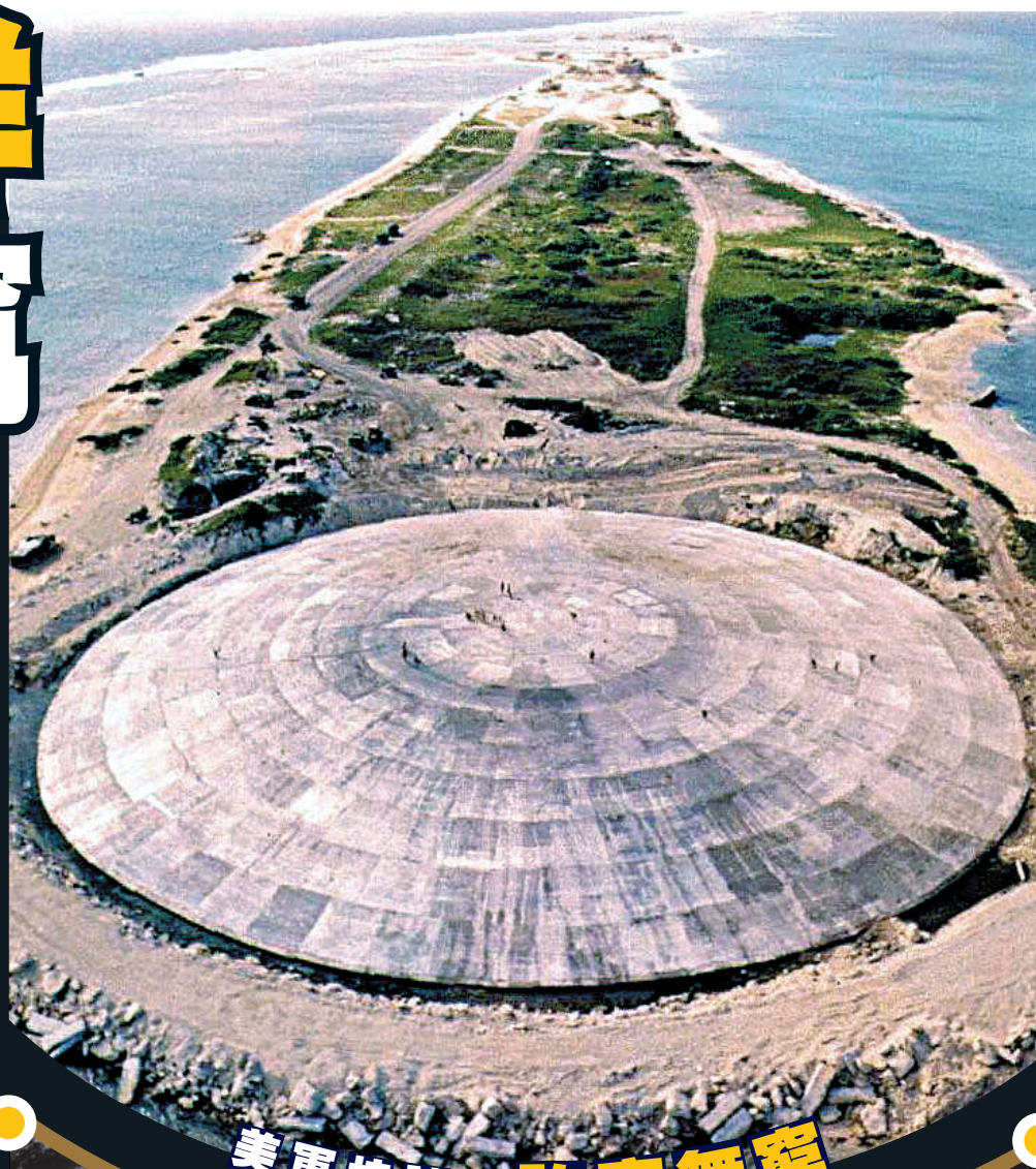
美軍核試驗貽害無窮

今年7月13日，馬紹爾群島外交部長阿丁敦促美國提供更多資金，解決核試驗造成的遺留問題。但美國總統太平洋島國談判特使伊汝尚聲稱，這個問題在上世紀80年代「已解決」。1988年，國際法院曾判美國向馬紹爾群島共和國支付23億美元，但美國國會拒絕接受該判決。《洛杉磯時報》披露，美國僅支付了400萬美元。面對放射性物質洩漏風險，馬紹爾群島官員曾向華府求助，但華府稱，「墳墓」在馬紹爾群島的土地上，因此是當地政府的責任。