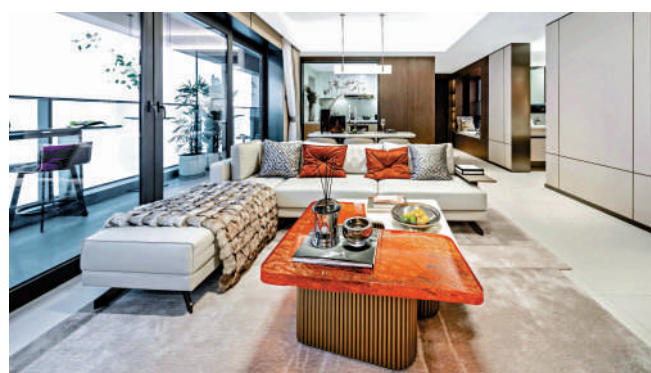
滿京華·金碩華府於本月開盤，首批揚言以吸引價發售。