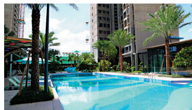
綠城匯銀·桂語蘭庭依不同年齡段的業主，區分了泳池空間。