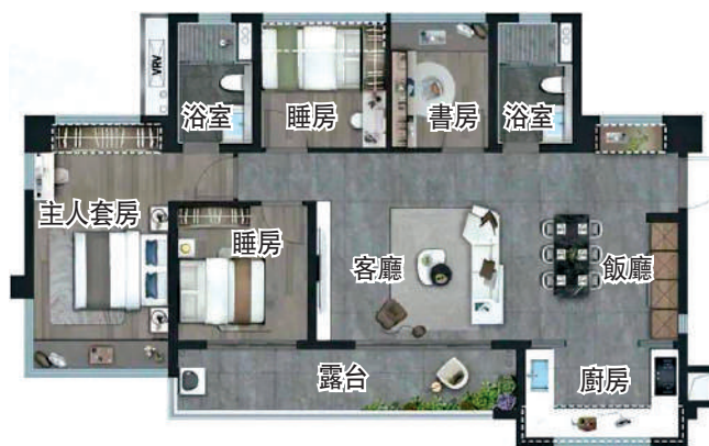
戶型圖。龍湖·御湖境120平方米四房兩廳。

據悉，龍湖·御湖境的景觀設計靈感源自於華爾道夫酒店，從大門到庭院，再到風雨連廊，每一處細節都以水為元素，精心設計「以水為景」的歸家動線，營造獨特的居住體驗。