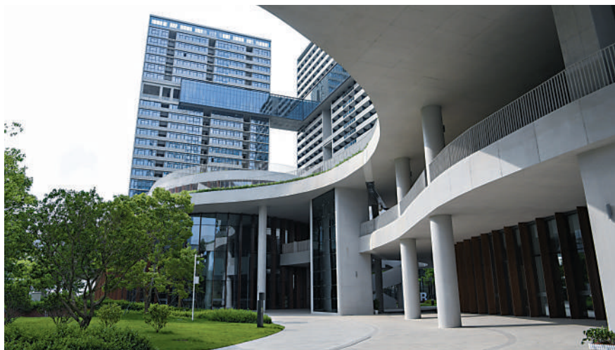
光明科學城正在建設24個重大科技創新載體，圖為啟動區外景。