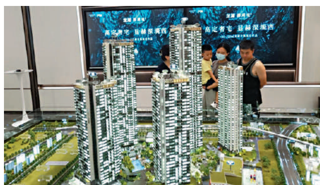
龍湖·御湖境示範單位已開放，圖為準買家參觀展銷廳。

記者還發現，為了吸引高學歷人群，光明科學城片區不斷提升公共服務配套。其中，科學公園佔地約208萬平方米，是深圳最大的市政公園，相當於兩個深圳灣公園，被稱為光明「綠色生態心臟」，將在本月建成；深圳科技館（新館）預計在今年底竣工，是深圳市科技創新發展新地標和大灣區國際一流文化設施的標桿；深圳國際美術館預計於2024年竣工，將是中國展示研究世界文化的平台。