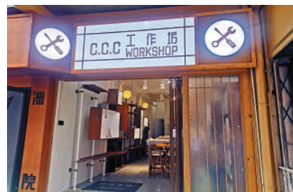
▲長洲文化館內開設多個工作坊。