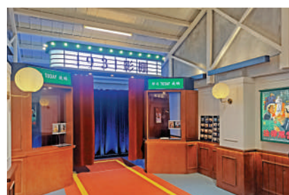
▲1931影棚前身是醬油廠，現被活化成「電影拍攝棚」。