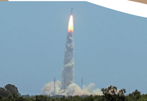
▲印度2日在達萬航天中心成功發射「日地L1點太陽」。