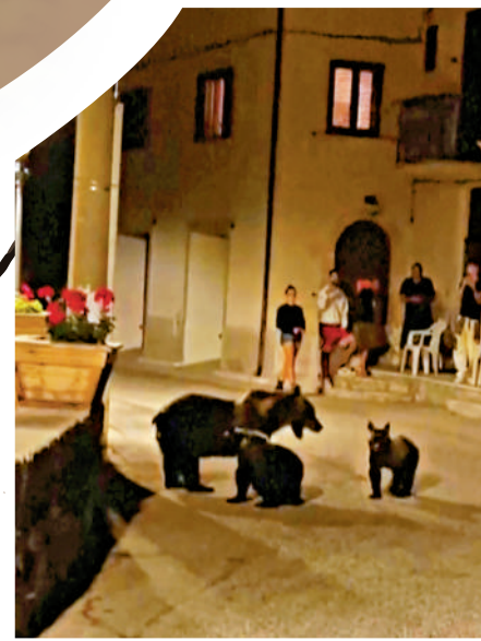
▼棕熊阿瑪雷娜8月26日在意大利聖塞巴斯蒂亞諾德伊馬西鎮帶着幼崽散步。

國家公園管理部門稱，槍殺阿瑪雷娜並不合理，即使這隻棕熊曾破壞附近農作物，但牠「從來沒有對人類造成任何傷害」。環境部長皮凱托稱，這是一起「非常嚴重的事件」，並表示要盡一切可能保證棕熊的幼崽的安全。阿魯佐地區州長馬西利奧在社交媒體上譴責開槍是「不可理喻」的。