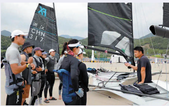
▲中國帆船帆板隊積極備戰亞運。

本屆亞運，中國帆船帆板隊將出戰男子水翼帆板、女子水翼帆板、男子水翼風箏板、女子水翼風箏板等10個小項，共計14名運動員參賽。在男、女水翼帆板，女子水翼風箏板，男子49er，女子49erFX和諾卡拉17這6個項目上，中國隊均有望爭奪金牌。