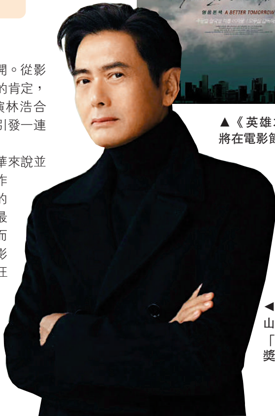
▲周潤發獲釜山國際電影節「亞洲電影人獎」。