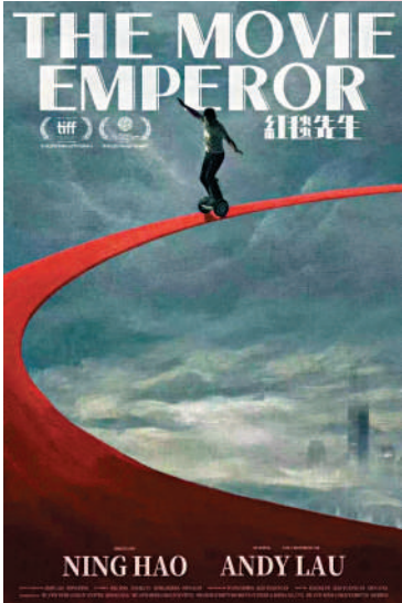
▲《紅毯先生》國際版海報。

【大公報訊】第28屆釜山國際電影節將於10月4日至13日於韓國釜山海雲台舉行。昨日，該電影節在記者會上公布周潤發將獲頒「亞洲電影人獎」。電影節官方指周潤發引領香港電影全盛期，把香港黑幫電影打造成世界性體裁，無論他拍動作片、愛情片、喜劇及古裝片都能發揮精湛演技，成為亞洲極有人氣的演員。