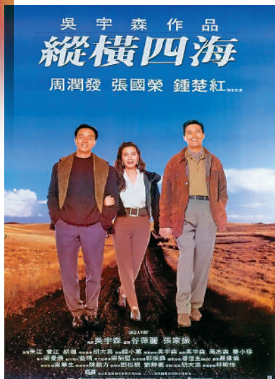
▲張家振與吳宇森合作始於《縱橫四海》。

張家振曾於紐約大學攻讀電影製作，是把吳宇森、周潤發、楊紫瓊等引向國際的重要推手，代表作包括《奪面雙雄》、《職業特工隊2》、《赤壁》、《辣手神探》、《縱橫四海》等。