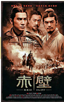
▲梁朝偉在《赤壁》中飾演周瑜。