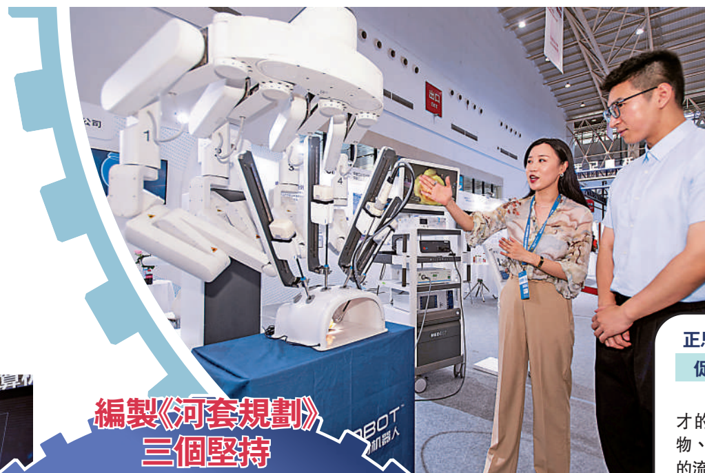
編製《河套規劃》三個堅持