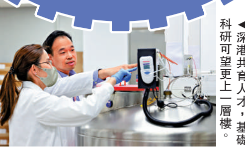
▲深港共育人才，基礎科研可望更上一層樓。