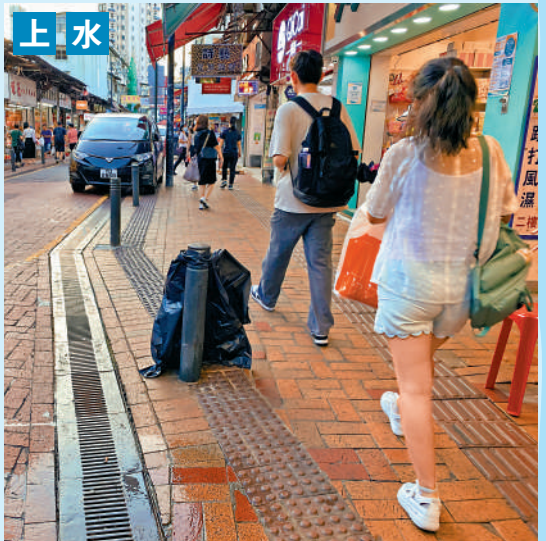
▲新康街冷氣機污水從高處滴到樓下行人路上，途人常被污水弄髒。