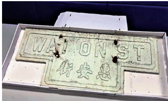
▲警方在記者會上展示檢獲的一塊失竊街名牌。

在今年7月起，相繼有市民發現在深水埗區內多個「T」形街牌被人非法拆除及偷走，路政署證實，一共有10個懷舊式T字形街名牌懷疑被非法移除，於是8月初報警求助。警方上月17日於深水埗區內，以涉嫌「連環盜竊」及「爆竊」拘捕一名49歲無業男子，涉嫌用簡單螺絲批工具拆除路牌，並以數千港元出售予不知名人士收藏之用，同類型事件在旺角及九龍城警區都有發生。該名男子已被暫控一項盜竊罪及一項入屋犯法罪，早前