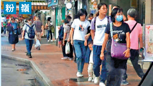
▲眾安街冷氣機污水如下雨般持續不斷造成水沓，途人需涉水而過十分不便。