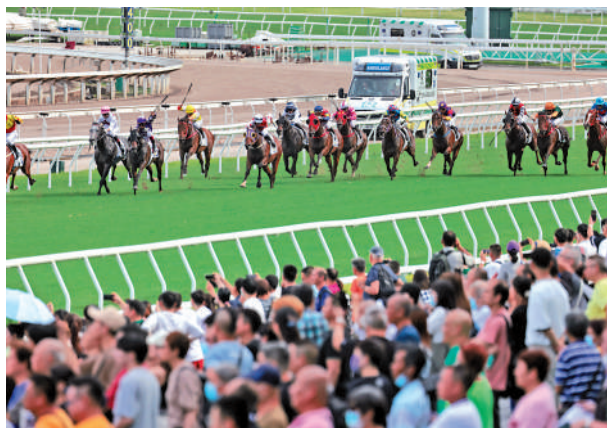
▲馬會表示，上年度賽馬投注總額與去年大致維持不變。