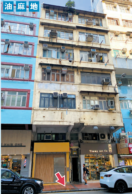
▲上海街大廈的冷氣機污水滴落在狹窄的行人道（箭指示），影響樓下巴士站候車的乘客。