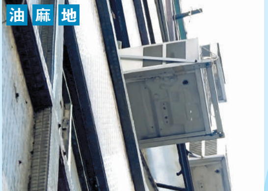
▲上海街有窗口式冷氣機沒有安裝排水管，任由冷凝水滴落街。