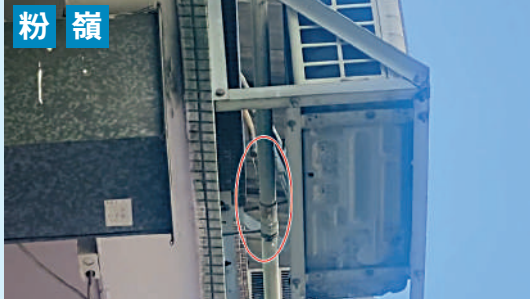
▲和豐街一大廈的窗口式冷氣機的喉管滴水，污水不斷滴落街頭（紅圈示）。