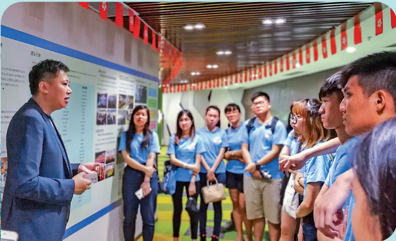
在深汕南山創業的港青（左）向前來暑期交流的香港大學生介紹當地發展情況。