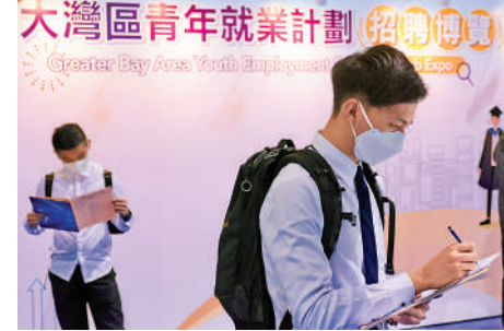
在香港的大灣區青年就業招聘會上，港青正在填寫申請表。

表示，一方面，各市「十四五」規劃有利於找到政府的關注重點及直接需求。從不同城市「十四五」規劃看，高端專業服務業是大灣區內地九市的發展重點，各市既重視本地專業服務的提升，也強調與香港合作、吸引香港專業服務