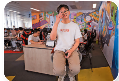
深圳的港青在自己的創業公司內留影。