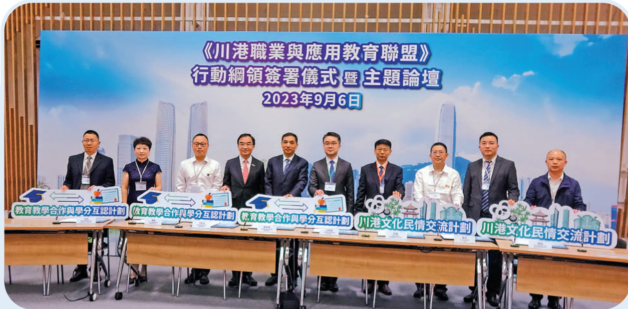
▲19間川港院校簽署《川港職業與應用教育聯盟》行動綱領，為兩地職業教育合作開闢新頁。

「川港教盟」的首批創始成員一共有19間川港院校，包括川方13所學院，覆蓋工業、師範、工程、建築、交通、文化、信息、郵電、紡織、財經和航空產業等，跨越領域非常廣泛。港方6所院校亦多樣化，包括資助院校及自資院校，當中有教育大學、港專學院、都會大學、東華學院、耀中幼教學院和製衣業訓練局。