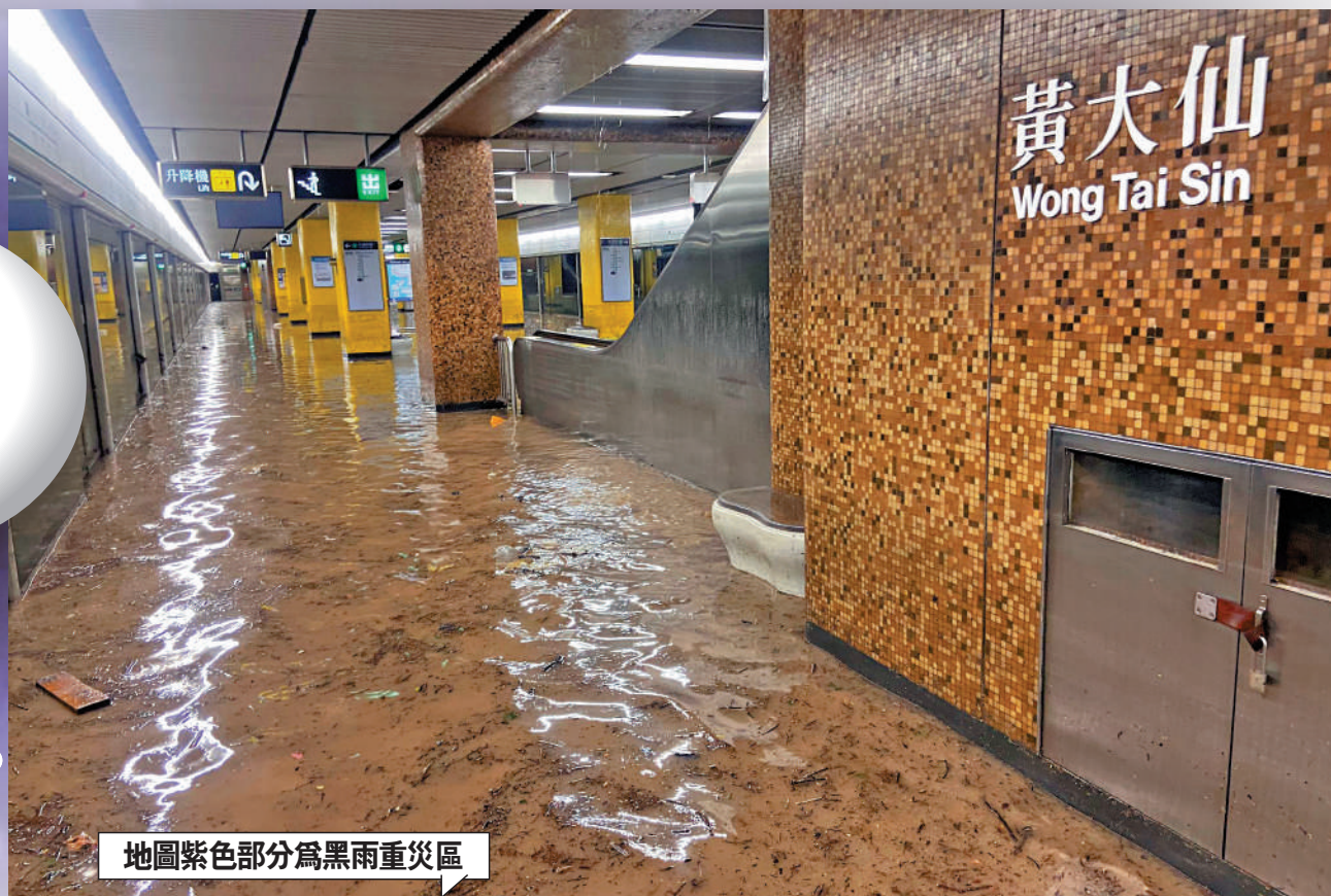
地圖紫色部分為黑雨重災區