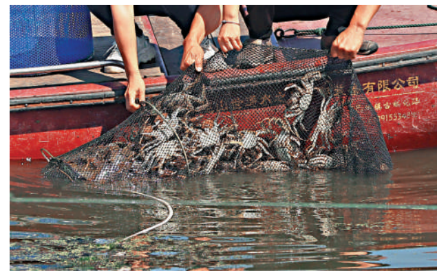
▲陽澄湖大閘蟹開捕是當地年度盛事，圖為往年養蟹戶撈大閘蟹場景。中新社