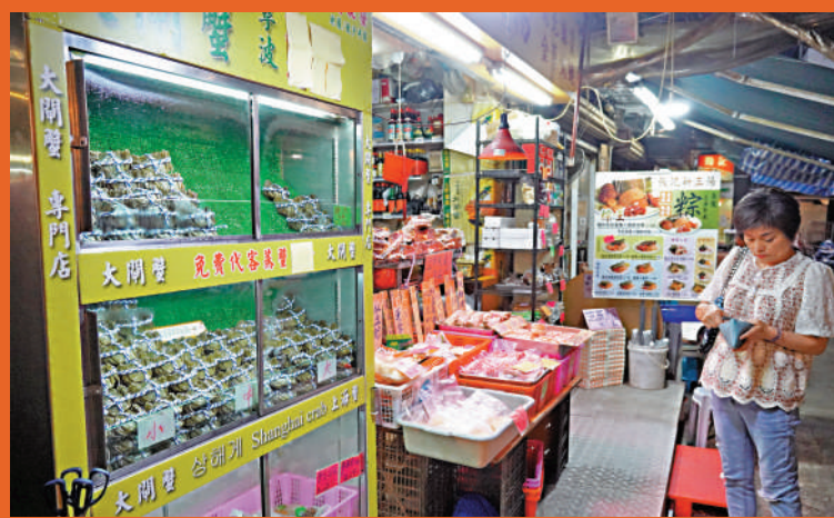
▲大閘蟹深受不少香港市民喜愛。圖為香港南貨店內出售的大閘蟹。

另一進口商、「三陽泰」負責人張繼鋼也向大公報記者表示，準備引入一批江蘇大閘蟹，首批約在九月下旬抵港，跟往年一樣，內地大閘蟹先運到韓國，取得批文後再轉運香港，他看好今年的大閘蟹銷情，若反應良好，不排除減價回饋食客。大公報記者賴振雄