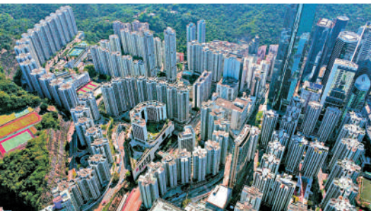
▲銀行上調新造按揭息率及縮減回贈優惠，難免進一步影響市民的入市意欲。

滙豐發言人表示，作為主要的市場參與者，滙豐致力確保本港的按揭市場能夠健康及持續發展。銀行會因應市場情況定期檢視按揭息率，並在需要時作出適當調整。「考慮到近日香港銀行同業拆息、本行的競爭力及市場價格等多項因素，本行決定調整按揭息率」。