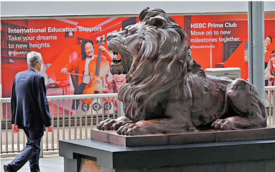
▲滙豐傳將調整按揭貸款利率，一、二手物業的H按封頂息率將上調0.5厘。