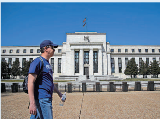
▲市場料美聯儲年內仍有機會加息一次。

中原按揭研究部指出，在今輪加息周期，美國累計加息幅度達5.25厘，而香港銀行只是加息0.875厘，屬歷年加息步伐最溫和的加息周期。