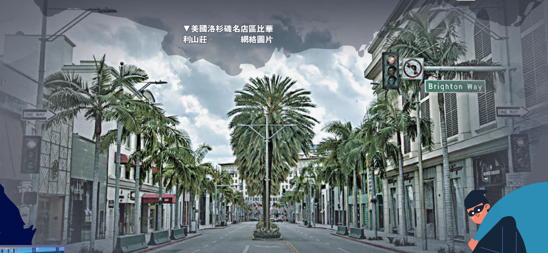
▼美國洛杉磯名店區比華利山莊。