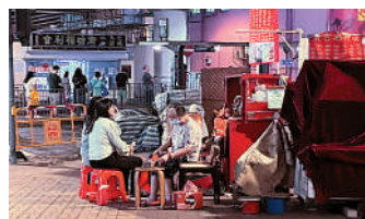
▲鵝頸橋的打小人攤檔不受雨災影響，如常營業。

忙於善後 香港遇上500年一遇大雨，到處都是水浸痕跡。昨日下午四時至六時，記者走訪銅鑼灣羅素街附近，一列街舖都沒有開門營業；鵝頸橋至灣仔太原街一帶，亦都有近半商舖未營業，當中有部分商家至傍晚仍在清理積水。 太原街上營業的排檔寥寥無幾，有販賣玩具及零食的街舖內，最底下兩層貨架清空，觀察水線疑似被雨水浸泡。莊士敦道上有兩三間