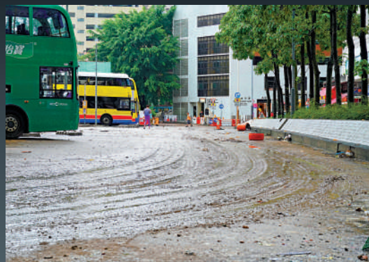
▲巴士站滿布泥濘，巴士服務一度暫停。