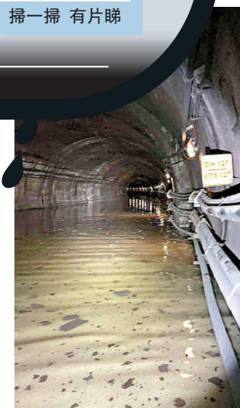
▲港鐵觀塘綫隧道嚴重水浸。