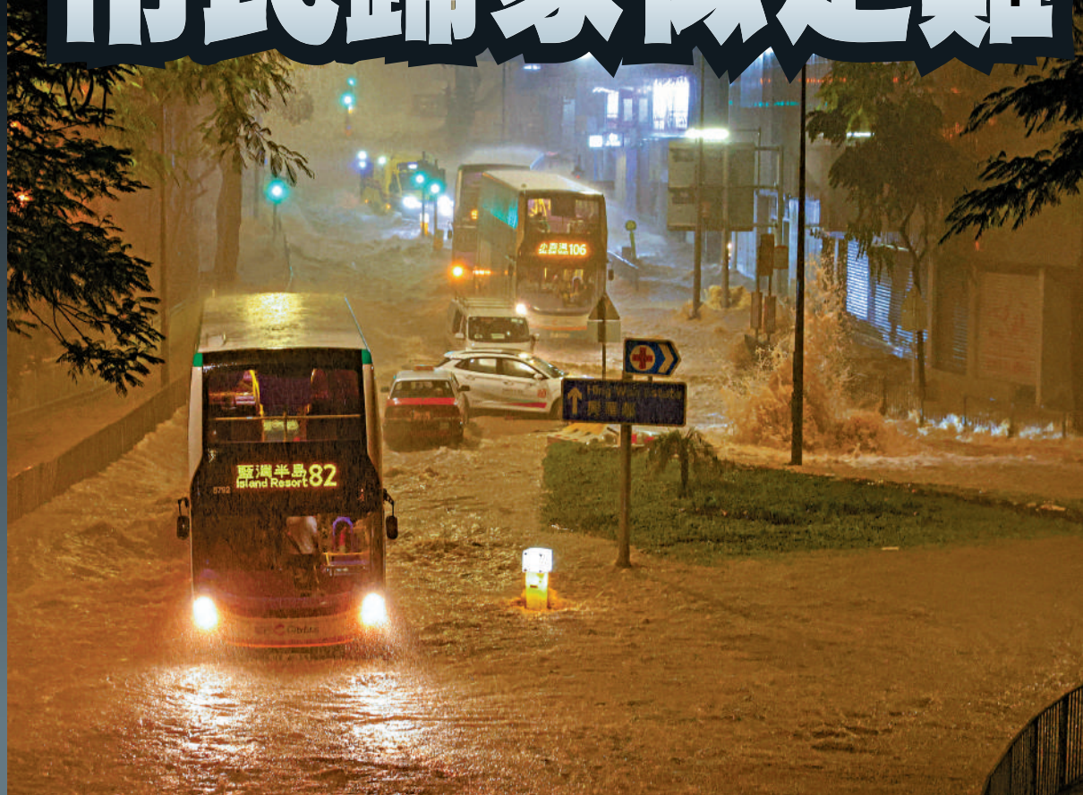
▲世紀暴雨肆虐，在柴灣，有大量巴士和私家車被困洪水之中，進退兩難。