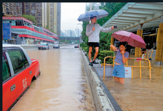
▲黃大仙龍翔道是水浸重災區之一，不少市民被困水中，涉水而至的途人，不忘打卡記錄這罕見一刻。