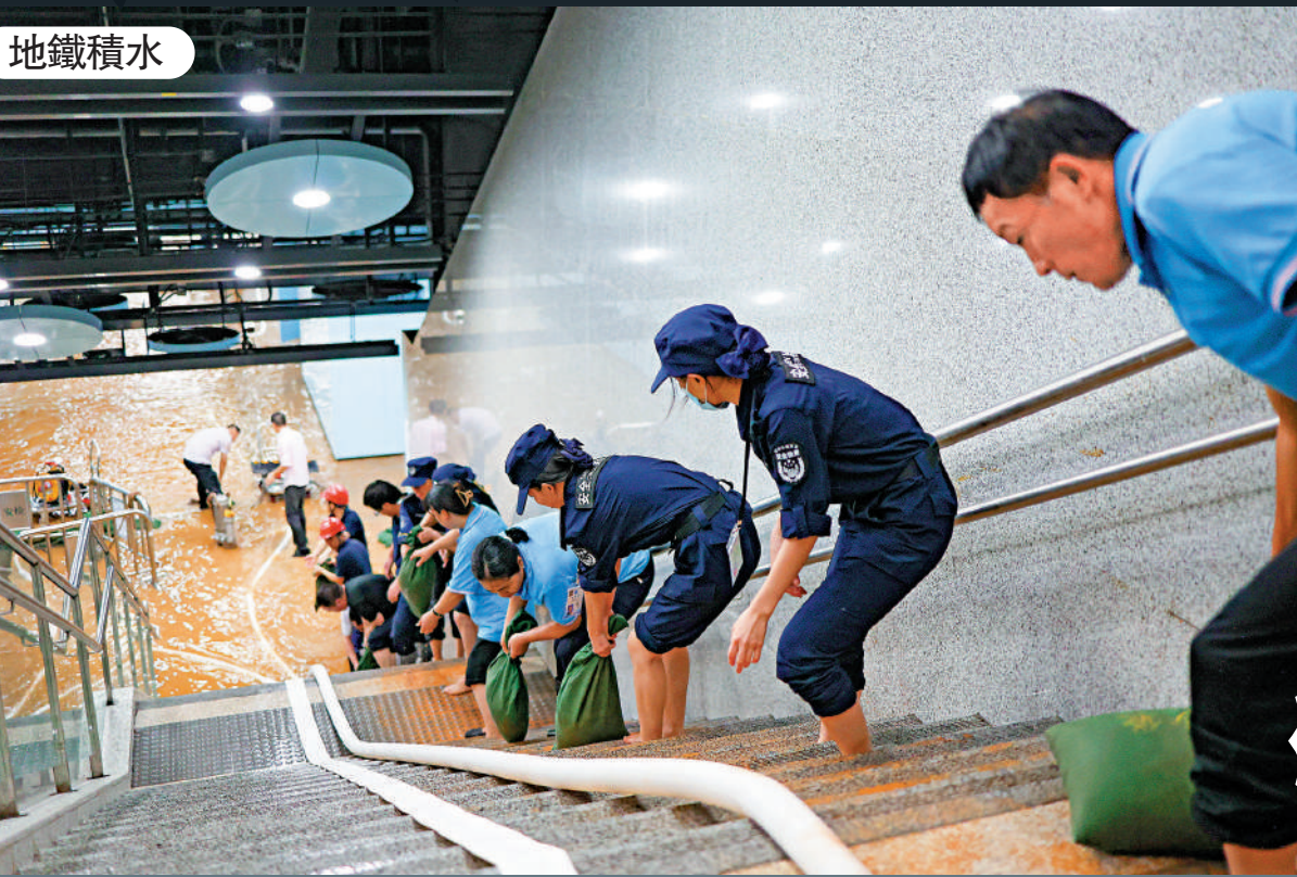
▶9月7日，在深圳地鐵黃閣坑站，工作人員接力搬運沙袋。