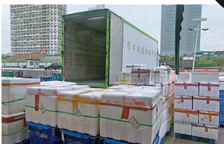
▲供港菜貨車在平湖海吉星裝菜。

完菜開始返港，預計要兩個多小時才能回到香港。他稱，由於不少司機多年未走過皇崗口岸，道路不熟悉影響通行效率，司機們期盼文錦渡口岸盡早恢復通行，節省時間。 大公報記者李昌鴻