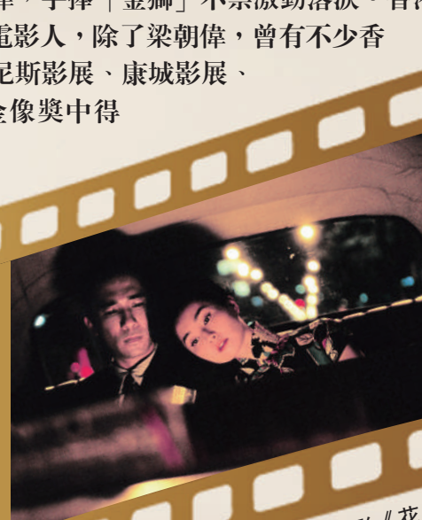
▲梁朝偉（左）與張曼玉曾合拍電影《花樣年華》。