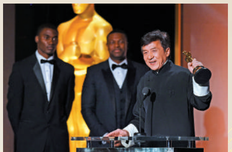
▲成龍2016年身穿長衫上台領取奧斯卡終身成就獎。

了……23年前，我在史泰龍（Sylvester Stallone）家中首次摸到了奧斯卡獎盃，我摸了，親了，還聞了，我感覺那座獎盃上還留有我的指紋。當時我告訴自己，我真的也想要一座奧斯卡獎盃……我感謝香港這座城市，也感謝自己的祖國中國，為自己是中國人感到自豪。」