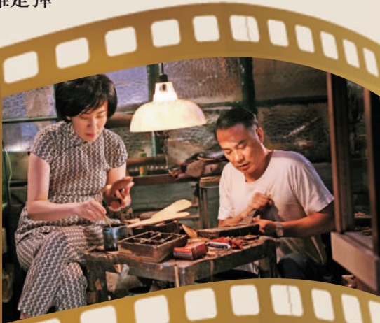
▲梁朝偉成為首位華人演員獲威尼斯影展終身成就金獅獎。