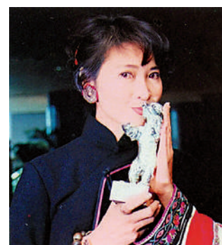
▲蕭芳芳1995年憑《女人四十》獲柏林影展女演員獎。

除了兩位出色的女演員揚威海外，香港音樂創作人金培達於2006年亦憑電影《伊莎貝拉》於柏林影展奪得「最佳電影音樂銀熊獎」；另外，由羅啟銳執導、張婉婷監製的香港電影《歲月神偷》，在2010年奪得「新世代」組別最佳影片水晶熊獎。