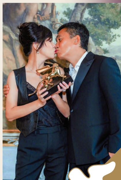
▲梁朝偉獲終身成就金獅獎後獲妻子劉嘉玲（左）吻賀。

十年後，73歲的導演許鞍華成為首位獲得終身成就金獅獎的華人女導演。當時許鞍華說：「開心到難以形容，我想把榮耀歸給香港，這個我成長、生活的地方。」另外，葉德嫻2011年憑《桃姐》摘下威尼斯影展「最佳女主角」，她亦是首位香港演員奪得此殊榮。