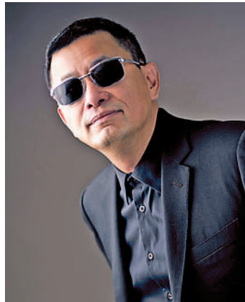
▲王家衛1997年獲康城影展「最佳導演」。

康城影展 法國康城影展1939年創辦，於每年5月舉行。1997年，王家衛憑《春光乍洩》成為首位在康城影展獲得「最佳導演」的華人導演；2000年，他執導的《花樣年華》獲頒「卓越技術成就大獎」，梁朝偉（偉仔）則憑該片成為香港史上首位康城「最佳男主角」，可謂雙喜臨門。當年37歲的偉仔得獎後說：「拿了獎，輕鬆了，好像安樂了，因為要拿的都拿了。」相信當時他想不到在23年後會揚威威尼斯影展，捧終身成就金獅獎而回。