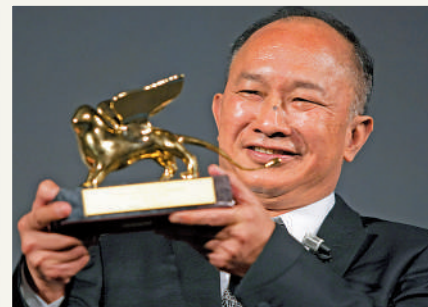
▲吳宇森2010年獲終身成就金獅獎。