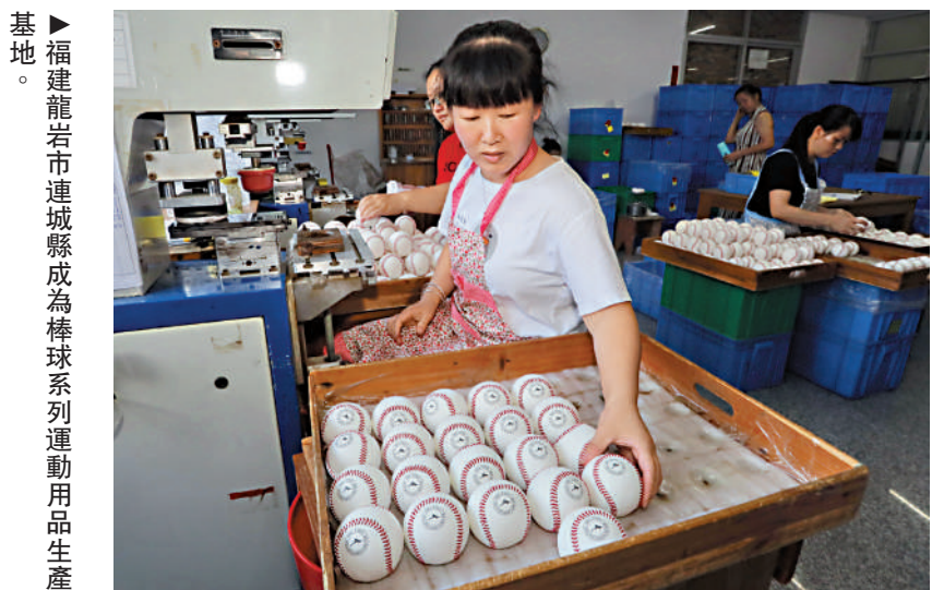
福建龍岩市連城縣成為棒球系列運動用品生產基地。