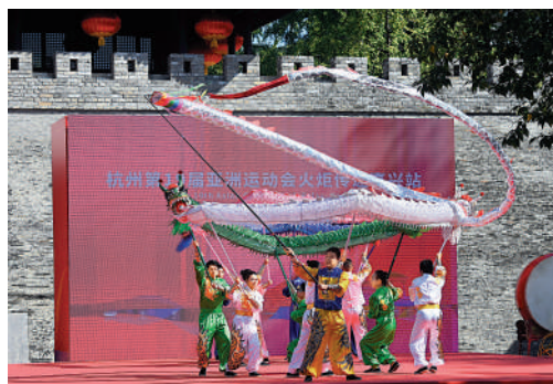
▲啟動儀式上演舞龍。

話你知 嘉興子城始建於三國吳黃龍年間，距今已有1790年的歷史，是嘉興最早的城垣，也是國內罕見的、保存完好的、演變脈絡清晰的縣、市、府衙署遺址。 2021年6月25日，子城遺址公園正式對外開放，成為融合歷史體驗、科研教育、文化交流、休閒遊憩等多功能於一體的嘉興城市新地標。