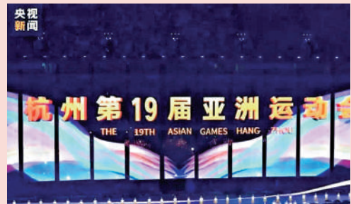
▲本次全要素綵排後，主創團隊將對視頻、服裝、道具和部分設備進行再度調整。