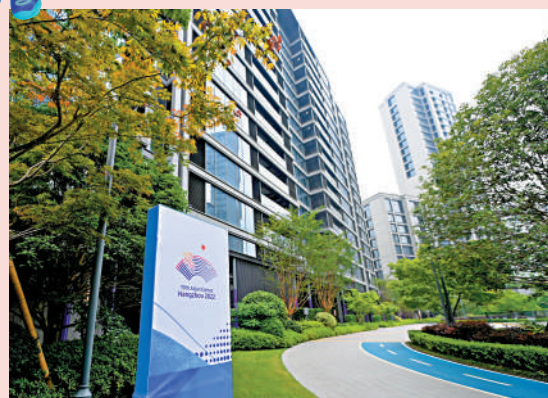
▲部分國家（地區）奧會先遣團於亞運村內開展籌備工作。

代表團註冊會議由NOC服務團隊牽頭，競賽管理、註冊製證、住宿分配等重要業務運行團隊——與代表團確定競賽報名、註冊類別、代表團規模、住宿分配、抵離安排、財務收費等重要資訊。按照慣例，註冊會議於亞運村預開村當天開始，亞運會開幕式前一天結束，預計舉行45場會議。