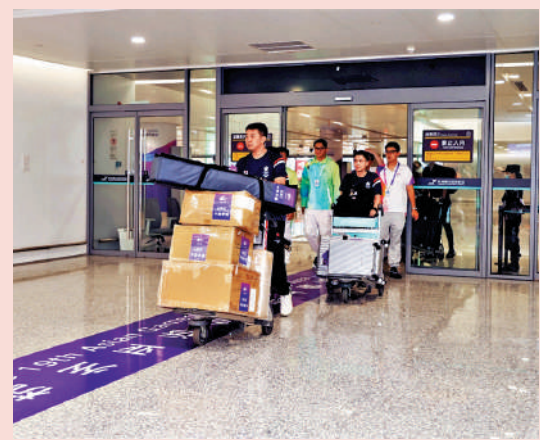
▲中國香港代表團先遣團日前已抵達杭州。