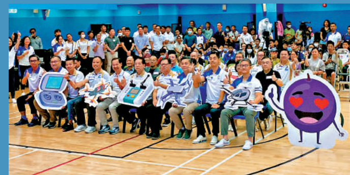
蕭澤頤期望青少年能透過活動得到啟發，增強防範網上罪行的危機意識。

據了解，除了學生在創科企業實習之外，該活動在上海和香港還進行了逾40小時的啟迪活動，包括參觀、講座和工作坊等，讓學生從多角度了解業界趨勢，致力促進年輕人才的實踐機會。啟迪活動的重點是由香港科學院院長盧煜明教授親自帶領學生，參觀創新診斷科技中心。盧教授向學生詳細介紹針對單基因疾病，以及其他妊娠相關症狀而研發的技術，更即席展示科研器材。學生們表示，活動激發了他們對科研的熱情，對國家創科成就的驕傲。