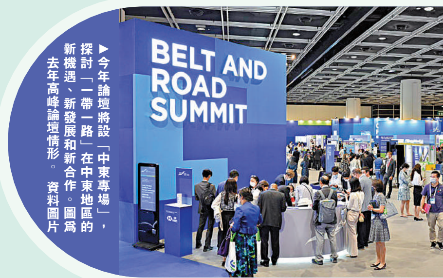
今年論壇將設「中東專場」，探討「一帶一路」在中東地區的新機遇、新發展和新合作。圖為去年高峰論壇情形。資料圖片