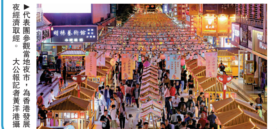
代表團參觀當地夜市，為香港發展夜經濟取經。