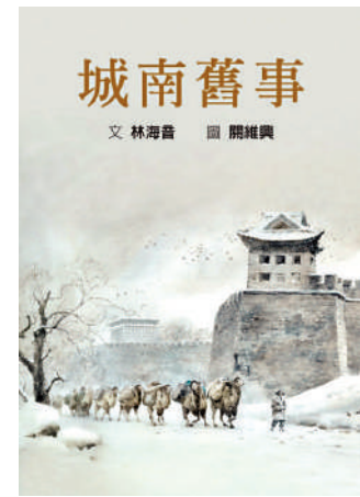
▲《城南舊事》，繁體版，林海音著，格林文化出版社。

我想，世間一切真愛，必會滲透在細節之中，正如清澈的山泉從最細碎的岩石縫中汨汨流出。這些細節也就是老舍先生說的「枝枝葉葉」。而當我們開始與一座城市的枝枝葉葉聯繫在一起，就完成了作為居住者與城市之間的互相「馴化」。徐則臣曾寫到，「一個城市與人的關係，其實也就是一個人與世界的關係」。對於這座城市裏的匆匆過客而言，建構與城市關係的介質各不一樣，郁達夫選擇了「四季」，史鐵生來到了「地壇」，俞平伯選了「陶然亭」，葉廣芩選了「頤和園」，許地山選的是「景山」，楊朔鍾情於「香山紅葉」，王統照忘不了「盧溝曉月」。城市的一切，無論多麼宏大、雄闊，最終都化作了屬於居民的小日子，城市因此變得具體、親切，城市的氣質、精神也由此融入我們的生活，日用而不知，踐行而不悔。