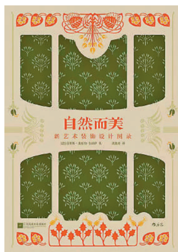
里斯·皮亞爾·韋納伊著，沈逸舟譯，江蘇鳳凰文藝出版社。

本書匯編了新藝術運動時期三本重要的作品，包括《植物與其裝飾應用》《裝飾中的動物》《鏤花模板裝飾》，收錄了73頁植物手繪和紋飾設計圖版、60頁動物紋飾、32種鏤花模板設計作品，充分展現了百年前新藝術運動以自然為靈感、通過裝飾生活空間來創造生活的宗旨。全書400多幅寫生和設計圖均由藝術家手繪。寫生作品凝練着自然物的形態之美，藝術展成線，線匯聚成形，再凝結成物象，在纖麗的靈動中傳遞着人用雙手復現自然的奇跡。紋飾設計圖則將提取後的自然形態重新注入木、石、布、土（陶瓷）、金屬等自然物之中，人文的創造力在作品中熠熠生輝。