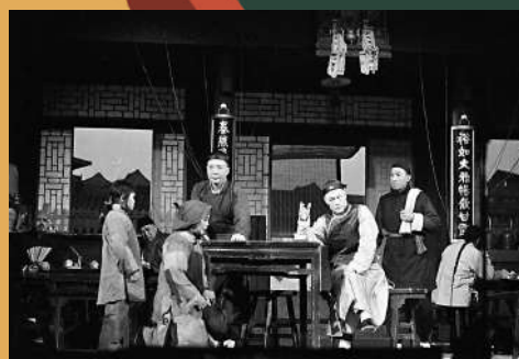
▲1979年版話劇《茶館》演出劇照。資料圖片