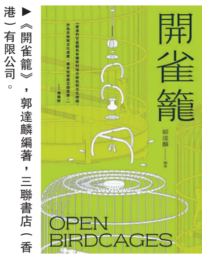
港)有限公司。郭達麟編著，三聯書店(香港)有限公司。