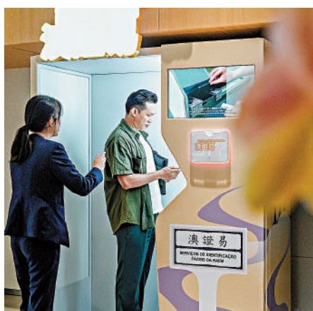
▲澳門居民在橫琴粵澳深度合作區政務服務中心體驗「澳證易」。

為推動澳門政務服務向橫琴延伸，該服務中心設立了「澳門服務專窗」，專窗服務內容涵蓋商事登記、社保、不動產、公證等事項，為澳門辦事群眾提供更優質高效的服務。同時，該中心逐步實現澳門居民在橫琴辦理各項澳門政務服務。目前，澳門身份證明局政務自助服務機「澳證易」、澳門財政局自助服務機已成為首批進駐中心的澳門政務自助服務設備。