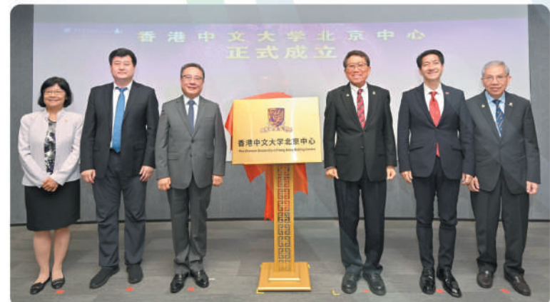
▲6月28日中大北京中心在北京市東城區舉行成立典禮，揭牌儀式合照左起：中大副校長岑美霞、北京市人才工作局局長張若冰、北京市副市長劉宇輝、中大校長段崇智、香港特別行政區政府駐北京辦事處主任鄭偉源、中大副校長陳偉儀。

6月28日，中大北京中心在北京市東城區舉行成立典禮，北京市副市長劉宇輝，北京市人才工作局局長張若冰，香港特別行政區政府駐北京辦事處主任鄭偉源，香港中文大學校長段崇智、副校長陳偉儀、副校長岑美霞以及來自北京市政府、北京市人才工作局和東城區政府的相關領導、京津冀的中大校友、北京中心合作單位負責人和京港媒體一同參與揭牌儀式，共同見證香港中文大學北京中心的成立。中大與合作夥伴在儀式上簽署了兩份合作交流備忘錄，其中，與北京市人才工作局的備忘錄將共同促進中大各院系與北京市高校、科研院所、企業及其他機構在多方面開展合作計劃。