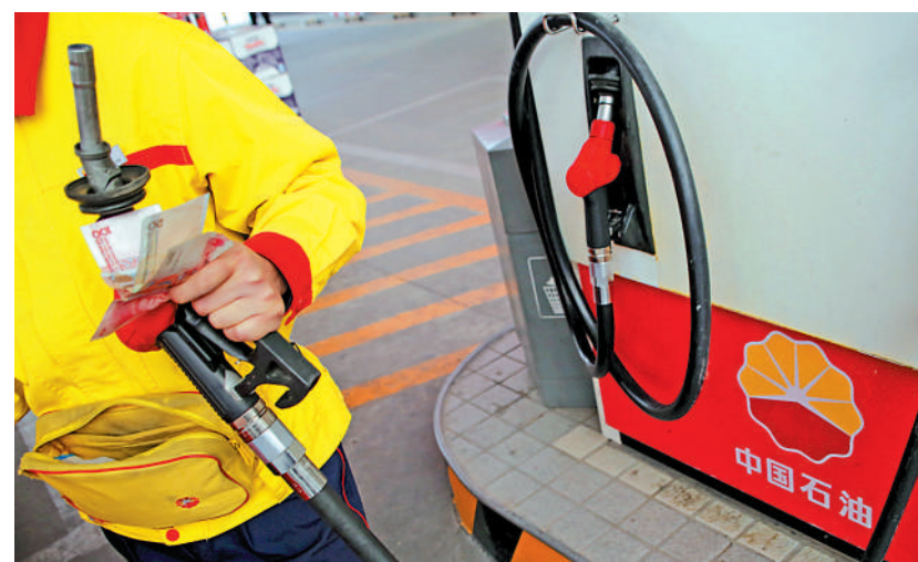
政治及經濟因素令國際油價易升難跌，油股前景看高一線。

(六) 美國能源企業雪佛龍在澳洲液化天然氣工廠員工罷工，可能影響全球10%天然氣供應，這是近月油價價格升勢加快的因由。