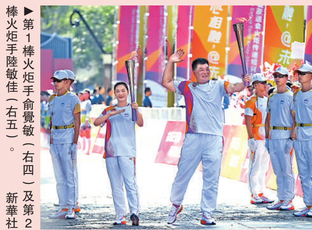
▲香港立法會議員陳仲尼（左）是第11棒火炬手。