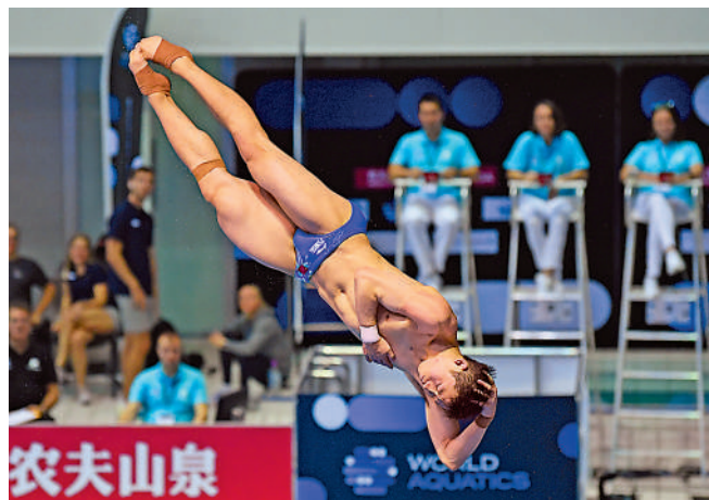
▶王宗源實力強勁，是中國跳水隊主力。

中國跳水隊領隊周繼紅說，主要還是要發揮出自己的水平，表現出自己的風格，尤其年輕運動員，在這種比賽中能夠得到鍛煉，我覺得就已經很好了。