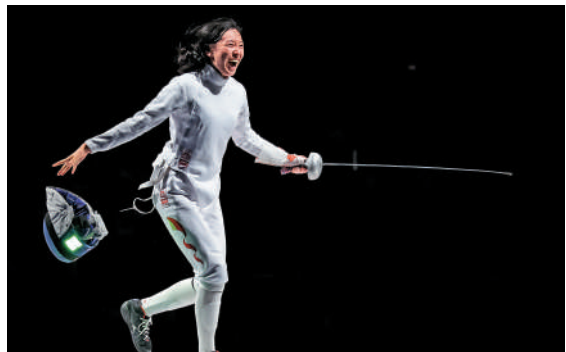
▲孫一文摘得世錦賽銅牌後，信心大增。

東京奧運奪冠後，孫一文因傷病原因，缺席了2022年的亞洲錦標賽和世錦賽兩大賽事。2023年，恢復訓練的她競技水平不斷提升。在7月進行的米蘭世錦賽中，孫一文奪得了女子重劍個人賽