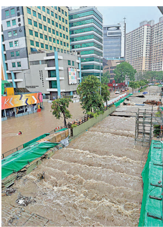
▲觀塘翠屏道暴雨下變成河流，多架車輛被困。