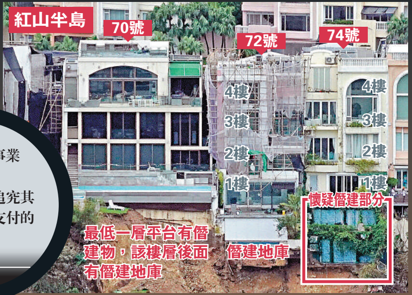
▲紅山半島受山泥傾瀉影響的三幢獨立屋中，70號及72號屋均被確建有僭建。 最低一層平台有僭建物，該樓層後面有僭建地庫 僭建地庫 懷疑僭建部分