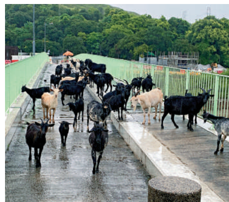
▲華叔居住的石湖新村近年也開始被收地，他盼望「老友記（羊）」能獲得妥善安置。