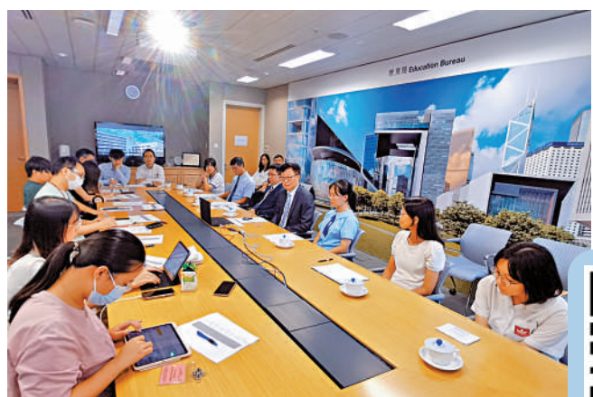
▲教育局昨天舉辦公民科內地考察團回顧和2023至24學年安排活動。

「課本中提到國家最新的發展，多次強調重大的建設，如高鐵、港珠澳大橋等等，課堂講得再多都有點紙上談兵。」順德聯誼總會譚伯羽中