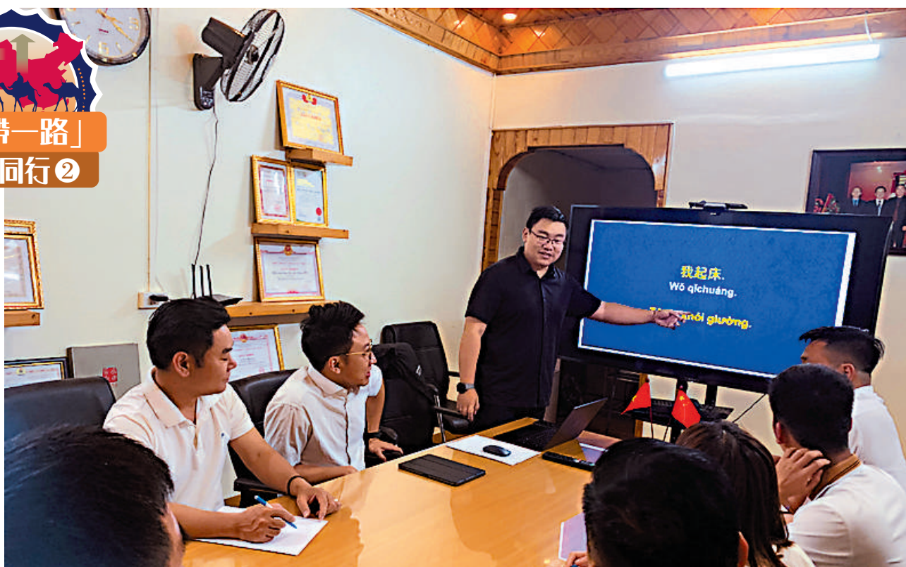
▲越中電力投資有限公司組織「雙語課堂」，讓越南本地員工熟悉中文。