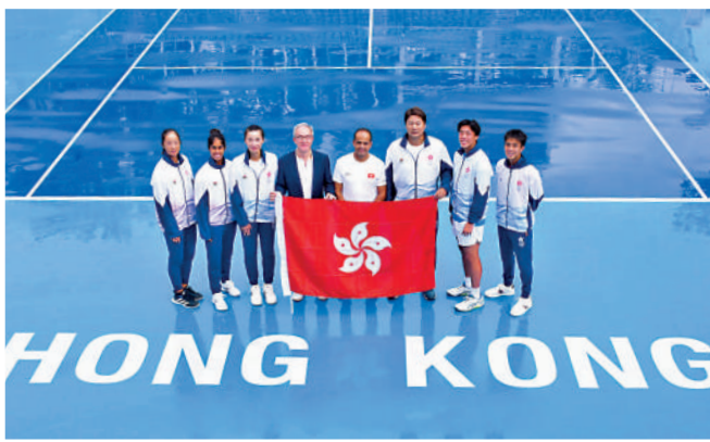
▲中國香港網球隊全力在亞運爭佳績。