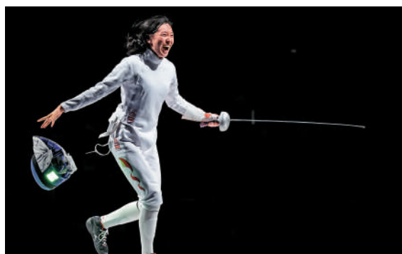
▲孫一文摘得世錦賽銅牌後，信心大增。

東京奧運奪冠後，孫一文因傷病原因，缺席了2022年的亞洲錦標賽和世錦賽兩大賽事。2023年，恢復訓練的她競技水平不斷提升。在7月進行的米蘭世錦賽中，孫一文奪得了女子重劍個人賽