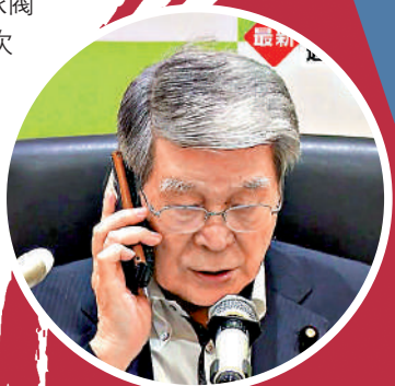
▲農林水產大臣野村哲郎早前受訪時提及「核污染水」激怒岸田。