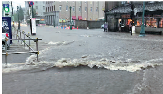
▲小樽市內街道上積水嚴重。

「已經很久沒見過這樣的大雨了。遊客好不容易開始多了起來，卻因為大雨無法做生意。」