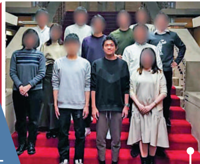
▲岸田長子和親戚在首相官邸模仿內閣全體大合影。

日本2016年引入My Number國民數碼身份證系統，但頻頻出現用戶資料外洩等致命傷。岸田內閣計劃擴大數碼身份證使用範圍，並宣稱將在2024年秋天廢除現行健康保險卡，招致罵聲一片。