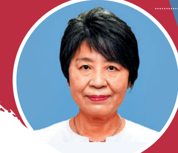
▲上川陽子將出任外務大臣。網絡圖片