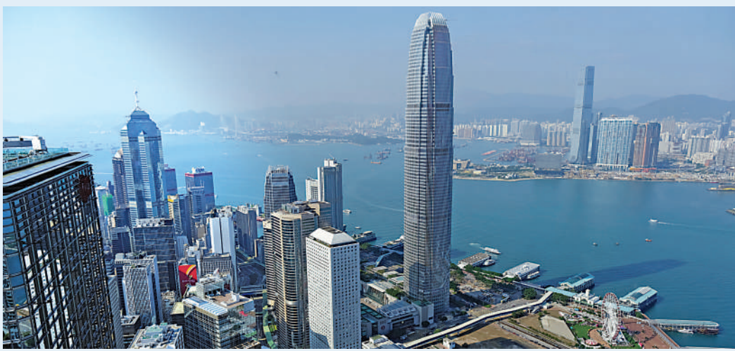
▲香港企業「走出去」成功的經驗，將可幫助內地企業拓展與沿線國家的合作，推動「一帶一路」成功落實。

國家已將「一帶一路」倡議確立為中長期發展規劃，作為一項攸關全方位對外開放、經濟結構轉型升級、實現穩定可持續發展成敗的新國策，「一帶一路」目前亟需規劃出具體的可操作性措施。此外，我們也需要對這項龐大的工程有專業的風險評估，以應對推動的過程中將遇到的考驗。