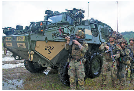
▲美韓上月舉行「乙支自由護盾」聯合軍演。

【大公報訊】綜合美聯社、韓聯社報道：美國總統拜登和韓國總統尹錫悅今年4月發表《華盛頓宣言》，宣布美國對韓實施「核保護傘」政策，以及頻繁向朝鮮半島出動能夠發射核武的戰略核潛艇，提高對朝延伸威懾的執行力。此後數月中，美國多艘核潛艇停靠韓國基地，上月更舉行美韓「乙支自由護盾」大規模聯合軍演，一再進行軍事